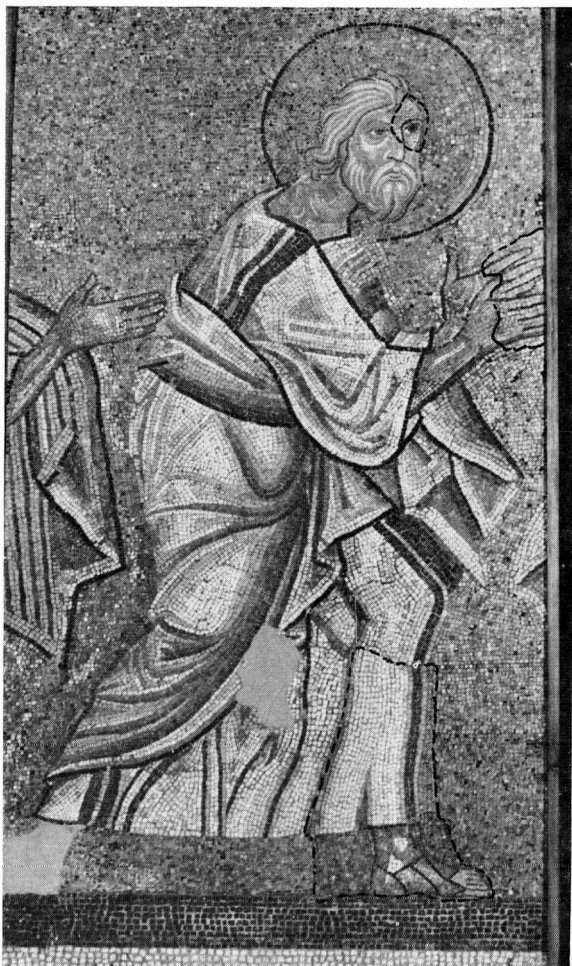
Ο Απόστολος Ανδρέας (Αρχαιολογικό Μουσείο Σερρών, υπέρχονσα κατάσταση).