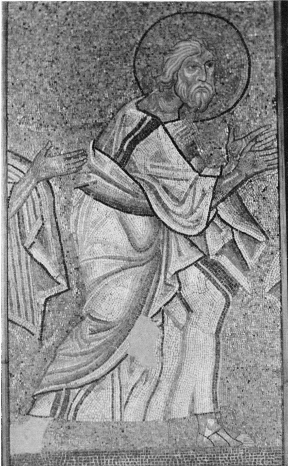
Ο Απόστολος Ανδρέας (Αρχαιολογικό Μουσείο Σερρών).