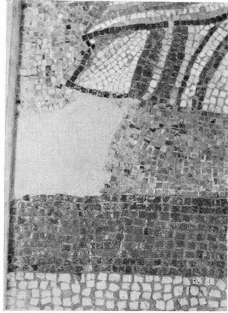
β. Ο Απόστολος Ανδρέας (Αρχαιολογικό Μουσείο Σερρών, λεπτομέρεια το δεξί πέλμα).