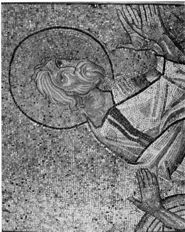
Ο Απόστολος Ανδρέας (Αρχαιολογικό Μουσείο Σερρών, λεπτομέρεια από τη μέση και πάνω).