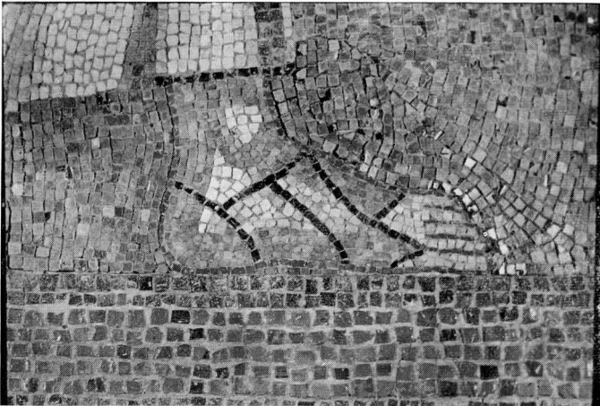
γ. Ο Απόστολος Ανδρέας (Αρχαιολογικό Μουσείο Σερρών, λεπτομέρεια με το αριστερό πέλμα).