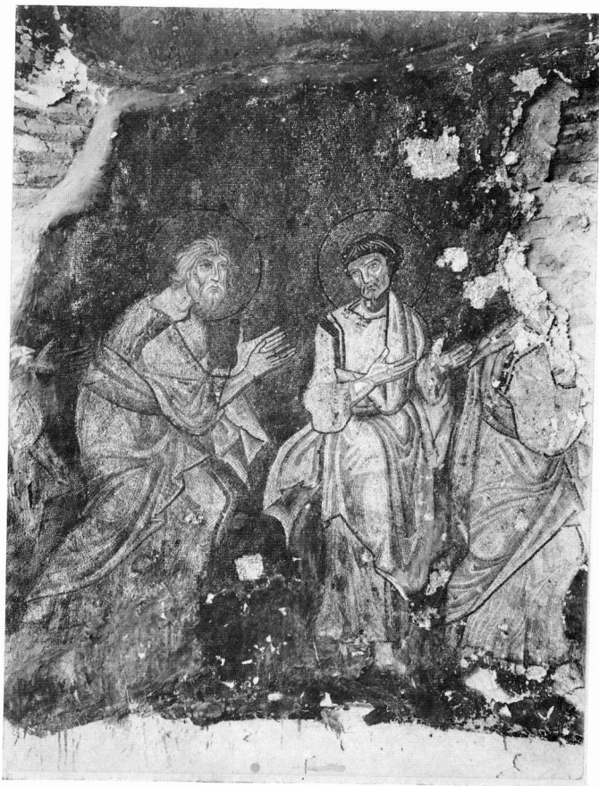
Οι Απόστολοι Ανδρέας και Λουκάς (Π. Μητρόπολη Σερρών, πριν από τη συντήρηση).