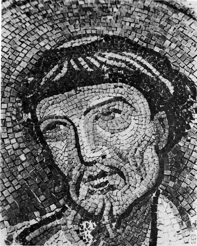
Ο Απόστολος Λουκάς (Π. Μητρόπολη Σερρών, λεπτομέρεια).