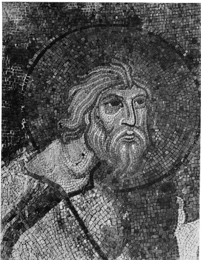
Ο Απόστολος Ανδρέας (Π. Μητρόπολη Σερρών, λεπτομέρεια).