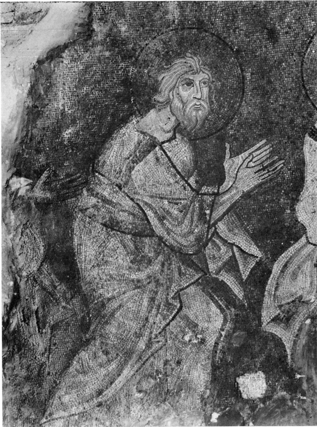
Ο Απόστολος Ανδρέας (Π. Μητρόπολη Σερρών, πριν από τη συντήρηση).