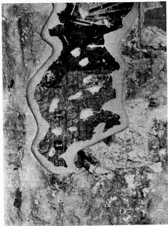
Παλιά Μητρόπολη Εδέσσης. Το ομοίωμα του ναού από την παραστάση των κτηρίων.