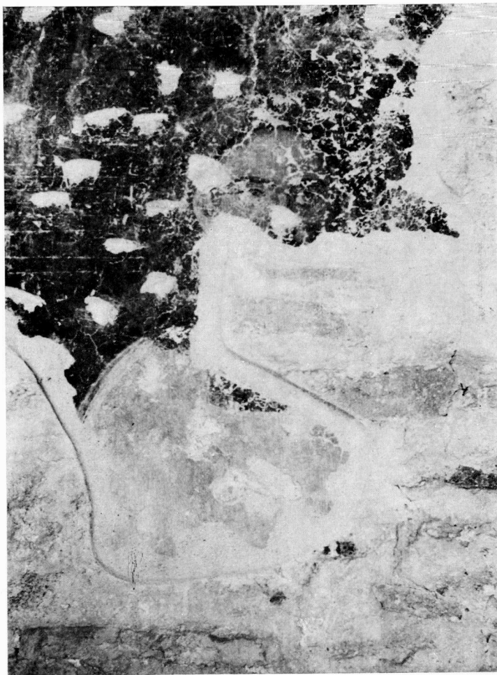
Παλιά Μητρόπολη Εδέσσης. Ο κτήτορας από την παράσταση των κτητόρων.