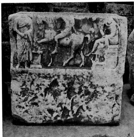
α. Πρόσοψη βωμού 298.