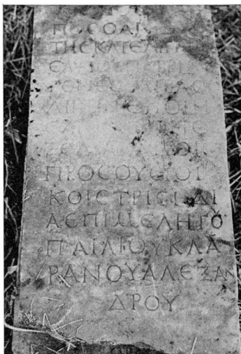
Εἰκ. 2. Τὸ δεύτερο κομμάτι τῆς ἐνεπίγραφῆς στήλης ἀπὸ τὸ «Παλιόκαστρο» Τερπνῆς

Τὸ κείμενο τῆς ἐπιγραφῆς παρουσιάζει σημαντικό ἐνδιαφέρον γιὰ τὴν τοπογραφικὴ καὶ ἱστορικὴ ἔρευνα. Πρῶτα πρῶτα μᾶς πληροφορεῖ γιὰ τὴν