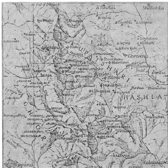
Χάρτης 1. Βλαχόφωνες περιοχές τῆς Δ. Μακεδονίας καὶ Θεσσαλίας

πωνυμίων γίνεται φανερό ότι τὰ τοπωνύμια πού συντάσσονται με τὴν πρόθεση la , δηλώνουν στὴν πλειονότητά τους μιὰ τοποθεσία ἀνοιχτὴ ὅσο ἀφορᾷ τὴ διαμόρφωση τοῦ ἐδάφους ἢ μεγάλη σχετικά σὲ ἔκταση: π.χ. la Kã-rãúlea al Kundudímu «στὸ καραούλι τοῦ Κοντοδήμου», la Pádea a Fãrlor «στὴν πεδιάδα τῶν κλεφτῶν». Ἀντίθετα αὐτὰ πού συντάσσονται με τὴν πρό-