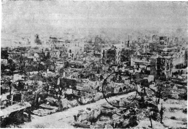
Εικ. 2. Ἡ καμένη περιοχή βόρεια ἀπὸ τὸ ναὸ τοῦ ἁγίου Νικολάου Τραπεζοῦ. Ἀριστερὰ φαίνεται μέρος τῆς Ἀχειροποιήτου καὶ ὁ μυναρὲς τῆς. Διακρίνεται τὸ κτίσμα μὲ τις δύο καμάρες στὴν πρόσοψη