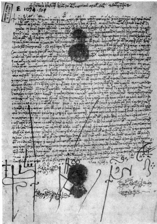
(Archivo General de Simancas - Sección Estado: legajo 1074, núm. 109)