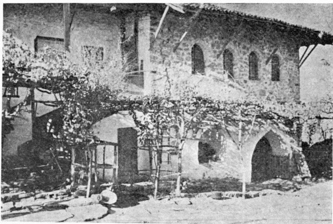
1. Τὸ σπίτι τοῦ Παπᾶ Χατζῆ Παναγιώτη