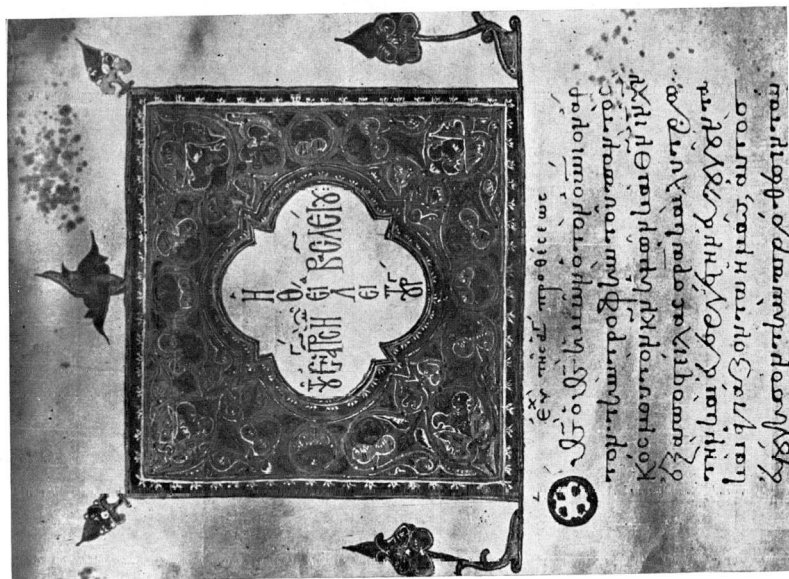
Εικ. 7. Λαύρας άφ. 11.