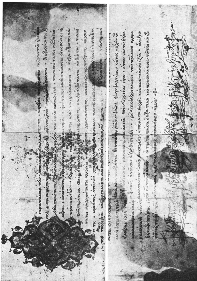
Εικ. 6. Ἡ ἀπάντησιν τοῦ ἡγομένου Φιλοθέου (ἀρχὴ καὶ τέλος τοῦ χειρογράφου).