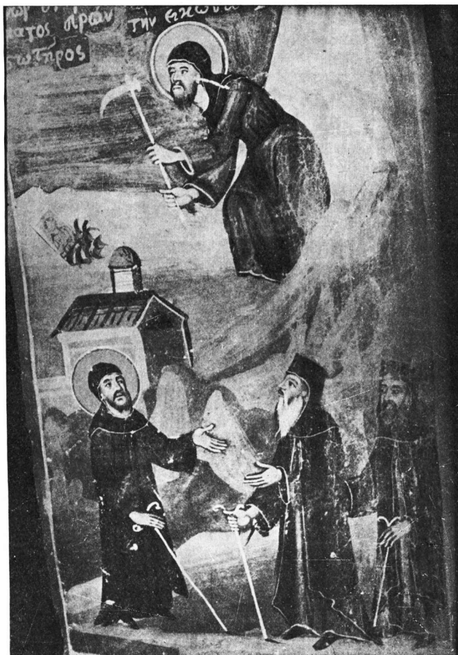
Εικ. 3. Ὁ Ὁσιος Νικάνωρ σκάβοντας βρίσκει τὴν εἰκόνα τοῦ Χριστοῦ. Τοιχογραφία τοῦ ναοῦ τῆς Μεγάλης Παναγίας στὴ Σαμαρίνα.