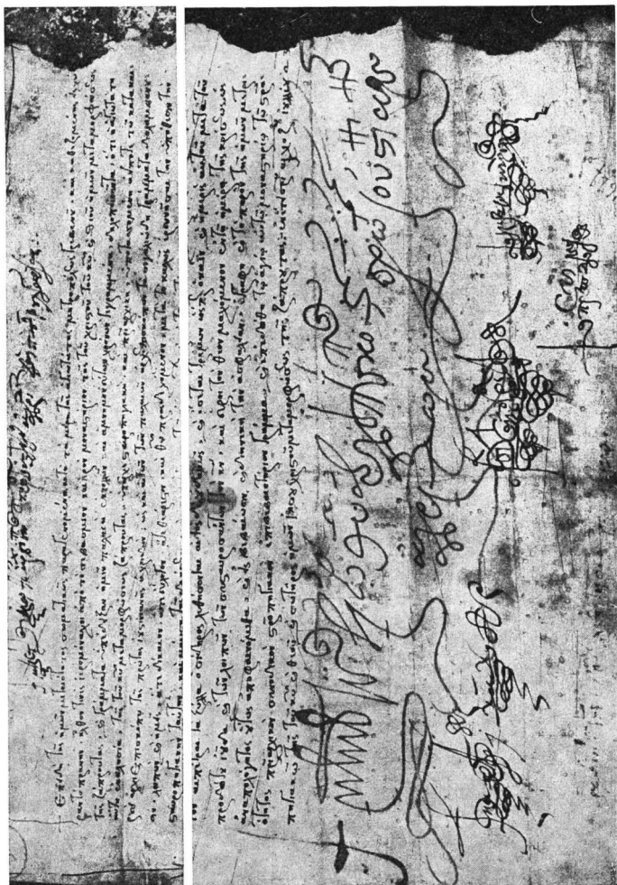
Εἰκ. 4. Τὸ στίγμα τοῦ ἀρχιεπισκόπου Ἀρχιδιὸν Μελετίου (ἀρχὴ καὶ τέλος τοῦ χειρογράφου).