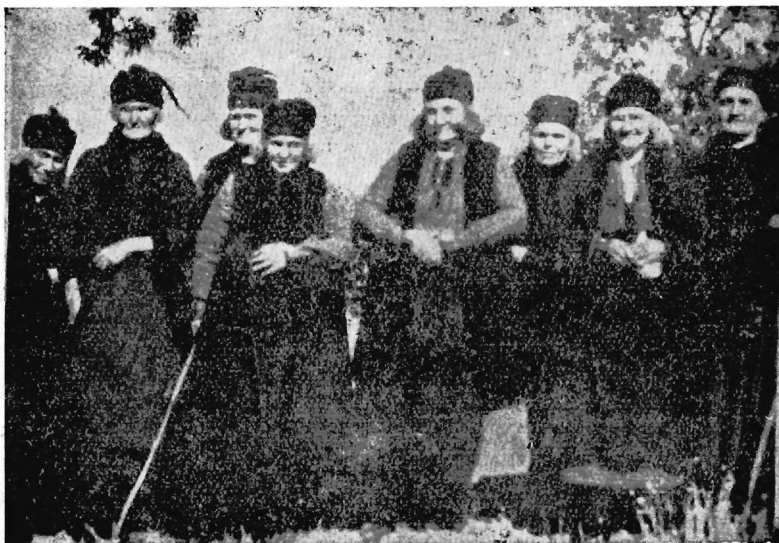
Εἰκ. 2. Γυναῖκες τοῦ Βογατσικοῦ μὲ τὰς παλαιὰς ἐνδυμασίας των.

Σήμερον ἐξέλιπον ὅλα ἐκεῖνα τὰ ἀγνά καὶ συγκινητικά ἔθιμα. Αἱ σχετικαὶ συνθήκαι ἐκ βάθρων ἤλλαξαν. Οἱ περισσότεροὶ τῶν ἀποδημούντων Βογατσιωτῶν παραλαμβάνουν μαζί των καὶ τὰς οἰκογενεῖας των, μονίμως πλέον ἐγκαθιστάμενοι ἐν τῇ ξένη. Μόνον κατ' ἀραιὰ χρονικὰ διαστήματα καὶ δι' ὀλίγον μόνον χρόνον ἐπισκέπτονται, χάριν ἀναψυχῆς καὶ πρὸς ἱκανοποίησιν τοῦ νοσταλγικοῦ των αἰσθήματος, τὴν ἰδιαιτέραν πατρίδα των. Ἐν τούτοις, καὶ ἐν τῇ ξένη ζῶντες οἱ Βογατσιῶται, δὲν λησμονοῦν τὴν γενέτειράν των,