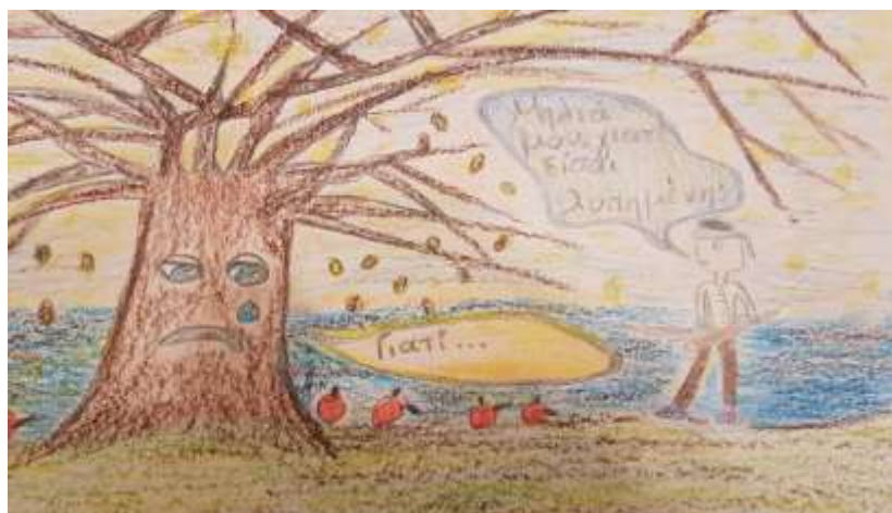
Εικόνα 4: Ο λυράρης τραγουδιστής ρωτά το δέντρο γιατί είναι λυπημένο

Τη σχολική χρονιά 2017-2018, στο 2ο Εκπαιδευτικό Πρόγραμμα - Διαγωνισμό το σχολείο απέσπασε πρώτο βραβείο με το έργο: «Χαμόμηλον», εικονογράφηση παραδοσιακού τραγουδιού από μαθητές/μαθήτριες του Ολοήμερου και δεύτερο βραβείο «Οι Μωμόγεροι», ταινία - ντοκιμαντέρ από μαθητές/μαθήτριες της τάξης Δ2'. Στο παραδοσιακό τραγούδι «Χαμόμηλον», μέσα στην όμορφη φύση του Πόντου ένα αγόρι κι ένα κορίτσι δίνουν όρκους αγάπης κάτω από τα κλαδιά μιας μηλιάς. Το δένδρο είναι μάρτυρας της αγάπης τους. Όμως το ζευγάρι χωρίζεται και το δένδρο ξεραίνεται. Αισθάνεται πως φέρει ευθύνη για τον χωρισμό, γιατί ήταν μάρτυρας την ώρα που οι δύο νέοι έδιναν την υπόσχεση για παντοτινή αγάπη (Ευσταθιάδης, 1981). Στόχος της επιλογής του συγκεκριμένου παραδοσιακού τραγουδιού ήταν να συνειδητοποιήσουν οι μαθητές και οι μαθήτριες πως οι καημοί, τα βάσανα της αγάπης, η ομορφιά της αγαπημένης, οι σχέσεις, γενικά, των ανθρώπων τραγουδήθηκαν από τον ελληνικό λαό σε όποιο μέρος της Ελλάδας κι αν κατοικούσε. Η σύνδεσή τους με τα «Λιανοτράγουδα» της Κύπρου και της Κρήτης οδήγησε τους/τις συμμετέχοντες/συμμετέχουσες να κατανοήσουν, μεταξύ άλλων, τους ισχυρούς δεσμούς των Ελλήνων του Πόντου με τους Έλληνες και τις Ελληνίδες της υπόλοιπης Ελλάδας καθώς, επίσης, «ότι τα δημοτικά τραγούδια και η δημοτική ποίηση αποτελούν έναν λαογραφικό και γλωσσικό θησαυρό και μαρτυρίες της συλλογικής μνήμης» (Πρόγραμμα Σπουδών για το μάθημα της Ιστορίας στις Γ', Δ', Ε' και ΣΤ' τάξεις του Δημοτικού Σχολείου, 2022).