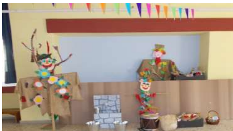
Εικόνα 6: Η «Κουσκουντέρα», έθιμο για την ανομβρία

σκιάχτρο. Χρησιμοποιούσαν μια σκούπα και παλιά ρούχα. Στόλιζαν το σκιάχτρο με λουλούδια και πρασινάδα. Ομάδα παιδιών περιέφερε το σκιάχτρο από σπίτι σε σπίτι τραγουδώντας. Οι νοικοκυρές έβρεχαν το σκιάχτρο και έδιναν στα παιδιά, συνήθως, αυγά, αλεύρι, γλυκίσματα και νομίσματα. Επίσης πολύ διαδεδομένο ήταν το έθιμο με τα «Ραβδιά» καθώς και «Ο χορός και το τραγούδι» (Ακογλου, 1939). Στόχος της αναβίωσης των παραπάνω εθίμων ήταν η σύνδεσή τους με τα ευχετικά τραγούδια, όπως τα κάλαντα (Χριστουγέννων, Πρωτοχρονιάς, Φώτων), τα χελιδονίσματα, τα τραγούδια της Περπερούνας, δηλαδή, τα τραγούδια της λαϊκής παράδοσης μέσα από τα οποία τα παιδιά μπορούν να παίζουν, να τραγουδήσουν, να παίζουν θέατρο, να δημιουργήσουν με πρόχειρα υλικά σκηνικά, να κατανέμουν ρόλους, να συνεργαστούν, να επικοινωνήσουν και να δημιουργήσουν (Ανθολόγιο Λογοτεχνικών Κειμένων Α΄ και Β΄ Δημοτικού, Το δελφίνι, 2006, σ. 46, 47).