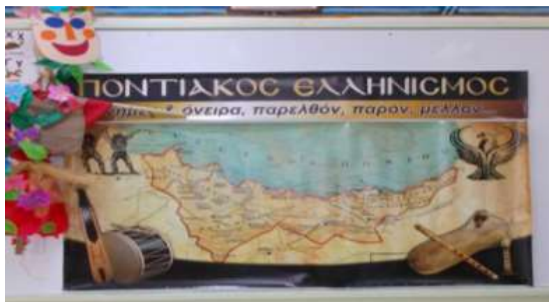
Εικόνα 1: Ο χάρτης του Πόντου

το 1923, με ιδιαίτερη αναφορά στη γενοκτονία του Ποντιακού Ελληνισμού. Στόχος του προγράμματος ήταν να γνωρίσουν οι συμμετέχοντες/συμμετέχουσες σημαντικά γεγονότα της ιστορίας των Ελλήνων του Πόντου με αρχή το θεματικό πεδίο της Ελληνικής Μυθολογίας (Πανελλήνιες εκστρατείες, όπως η Αργοναυτική Εκστρατεία), το θεματικό πεδίο της Αρχαίας Ιστορίας (Αποικισμοί, Ελληνιστικά χρόνια), το θεματικό πεδίο της Ελληνορωμαϊκής Ιστορίας καθώς και της Βυζαντινής (Ακρίτες του Πόντου), το θεματικό πεδίο των Νεότερων Χρόνων και της Σύγχρονης Εποχής εστιάζοντας στη γενοκτονία των Ελλήνων του Πόντου και της προσφυγιάς. Κατά τη διάρκεια του προγράμματος οι μαθητές και οι μαθήτριες εξοικειώθηκαν με την ορολογία της επιστήμης της ιστορίας, απέκτησαν σχετικό λεξιλόγιο, κατανόησαν τη σημασία της γεωγραφικής θέσης του Πόντου για τις ιστορικές εξελίξεις, χρησιμοποίησαν τις Τεχνολογίες της Πληροφορίας για να ερευνήσουν και να μελετήσουν το ιστορικό παρελθόν, άντλησαν ιστορικά στοιχεία ερευνώντας τη βιβλιογραφία, επισκέφτηκαν μνημεία, μουσεία και βιβλιοθήκες (Πρόγραμμα Σπουδών για το μάθημα της Ιστορίας στις Γ΄, Δ΄, Ε΄ και ΣΤ΄ τάξεις του Δημοτικού Σχολείου, 2022)