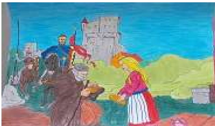
Εικόνα 8: «Το φτωχοκόριτσον», δίνει ψωμί στον ζητιάνο, ο οποίος της εύχεται να γίνει βασίλισσα

το σχολείο συμμετείχε με την εικονογράφηση του παραμυθιού «Το φτωχοκόριτσον - βασίλισσα» (Ακογλου, 1939, σ. 406, 407), μια συνεργασία μαθητών/ μαθητριών των τάξεων Β΄ και ΣΤ΄ (έπαινος συμμετοχής). Κεντρικό σημείο του παραμυθιού είναι το ψωμί που δίνει σε έναν ζητιάνο ένα φτωχό κορίτσι, ο οποίος ως ανταμοιβή, θα την κάνει βασίλισσα. Βασικός στόχος του έργου ήταν να διερευνήσουν τα παιδιά τη σημασία του σιταριού και του ψωμιού στην παραδοσιακή και σύγχρονη ζωή. Ερεύνησαν, δηλαδή, το ψωμί στη χριστιανική λατρεία (χριστόψωμα, λαμπροκουλούρες κ.ά.), συγκέντρωσαν παροιμίες (Κερδίζω το ψωμί μου), αινίγματα (Απ' τη γη χρυσάφι βγαίνει, στο στομάχι κατεβαίνει), διάβασαν σχετικά παραμύθια (Το φτωχοκόριτσον - βασίλισσα), το οποίο και εικονογράφησαν, έπλασαν, έψησαν και γεύτηκαν το δικό τους ψωμί, έφτιαξαν χειροτεχνίες με σπόρους δημητριακών, έφτιαξαν το δικό τους μουσείο στην αίθουσα της τάξης τους με αγροτικά εργαλεία και προϊόντα (Ανθολόγιο Λογοτεχνικών Κειμένων Α΄ και Β΄ Δημοτικού, Το δελφίνι, 2006).