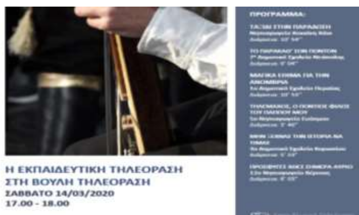
Εικόνα 7: Τα «Μαγικά έθιμα για την ανομβρία» στη Βουλή Τηλεόραση

Τη σχολική χρονιά 2019-2020, στο 4ο Εκπαιδευτικό Πρόγραμμα - Διαγωνισμό