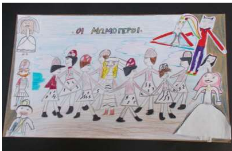
Εικόνα 5: Οι Μωμόγεροι

«Μώμος» (κοροϊδία) και γέρος. Συμβολίζει την πάλη του καινούριου με το παλιό, της ζωής με τον θάνατο, του νέου χρόνου με τον παλιό. Άλλοι, πάλι, υποστηρίζουν ότι συμβολίζει τα παλικάρια του Μεγάλου Αλεξάνδρου και η νύφη την Ελλάδα (Λαπαρίδης, 1975· Σαμουηλίδης, 1975). Συνήθως οι συμμετέχοντες στο δρώμενο φορούσαν φουστανέλα και περικεφαλαία του Μεγάλου Αλεξάνδρου. Σε μια παραλλαγή του δρώμενου, εξήντα (60) μεταμφιεσμένοι επάνω σε άλογα μιμούνταν την πορεία του Μεγάλου Αλεξάνδρου. Σε μια άλλη παραλλαγή, δώδεκα (12) νέοι φορώντας φουστανέλα και αρχαία περικεφαλαία αποτελούσαν τους μνηστήρες της νύφης. Άλλα πρόσωπα του δρώμενου ήταν ο γέρος, η γριά, ο διάβολος, ο γιατρός και ο χωροφύλακας. Ο αρχηγός της ομάδας έδινε συνθήματα και τα μέλη τα εκτελούσαν ρυθμικά (Χαιρόπουλος, 2007). Στόχος της αναβίωσης του συγκεκριμένου εθίμου ήταν να κατανοήσουν οι μαθητές και οι μαθήτριες ότι υπάρχουν πολλοί τρόποι αντίστασης για να διαμαρτυρηθεί και να αγωνιστεί ένας άνθρωπος ενάντια στην καταπίεση και στη δουλεία, γιατί «Οι Μωμόγεροι» ήταν όχι μόνο ψυχαγωγία αλλά και μια μορφή αντίστασης ενάντια στην καταπίεση των Τούρκων. Μέσα από τη σάτιρα εναντίον των πασάδων εξέφραζαν την επιθυμία τους για ελευθερία, ισότητα και δικαιοσύνη.