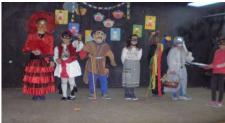
Εικόνα 2: «Εθίμα της Αποκριάς από τον Πόντο», ο εύζωνος σε δράση

Στο παραδοσιακό τραγούδι «Τ' Ηλ' το Κάστρον», ο λαϊκός ποιητής υμνεί τους Πόντιους μαχητές διαφόρων κάστρον, τα οποία μένουν απόρθητα για αρκετά χρόνια μετά την άλωση της Τραπεζούντας από τους Τούρκους (Ευσταθιάδης, 1981), ύμνησε, δηλαδή, την αντίσταση του Ποντιακού Ελληνισμού, τους Ακρίτες και ήρωες του Πόντου «Όλα τα κάστρα είδα κι όλα γύρισα κι άμον του Ήλ' το Κάστρον κ' έτονε. Σεράντα πόρτας είχεν κι όλα σίδερα κι εξήντα παραθύρια κι όλα χάλκινα και του γιαλού η πόρτα έτον μάλαμαν. Τούρκος το τριγυρίζει, χρόνους δώδεκα, μηδ' εμπορεί να παίρει, μήδ' αφήνει ατο ...» (Ευσταθιάδη, 1981, σ. 138, 139). Βασικός στόχος του προγράμματος ήταν οι μαθητές και οι μαθήτριες να διακρίνουν το ιστορικό γεγονός μέσα από την παράδοση, να κατανοήσουν την αξία των δημοτικών παραδοσιακών τραγουδιών, ως σημαντικές πηγές πληροφόρησης των αγώνων των υπόδουλων Ελλήνων για την ελευθερία και να κατακτήσουν τη γνώση με κριτικό και δημιουργικό τρόπο (Πρόγραμμα Σπουδών για το μάθημα της Ιστορίας στις Γ', Δ', Ε' και ΣΤ' τάξεις του Δημοτικού Σχολείου, 2022).