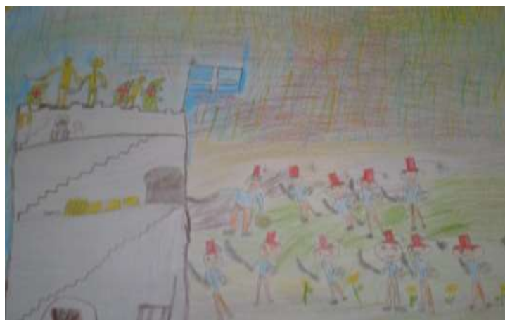
Εικόνα 3: «Τ' Ηλ' το Κάστρον», 12 χρόνια πολιορκίας

Στο παραδοσιακό τραγούδι «Τ' Ηλ' το Κάστρον», ο λαϊκός ποιητής υμνεί τους Πόντιους μαχητές διαφόρων κάστρον, τα οποία μένουν απόρθητα για αρκετά χρόνια μετά την άλωση της Τραπεζούντας από τους Τούρκους (Ευσταθιάδης, 1981), ύμνησε, δηλαδή, την αντίσταση του Ποντιακού Ελληνισμού, τους Ακρίτες και ήρωες του Πόντου «Όλα τα κάστρα είδα κι όλα γύρισα κι άμον του Ήλ' το Κάστρον κ' έτονε. Σεράντα πόρτας είχεν κι όλα σίδερα κι εξήντα παραθύρια κι όλα χάλκινα και του γιαλού η πόρτα έτον μάλαμαν. Τούρκος το τριγυρίζει, χρόνους δώδεκα, μηδ' εμπορεί να παίρει, μήδ' αφήνει ατο ...» (Ευσταθιάδη, 1981, σ. 138, 139). Βασικός στόχος του προγράμματος ήταν οι μαθητές και οι μαθήτριες να διακρίνουν το ιστορικό γεγονός μέσα από την παράδοση, να κατανοήσουν την αξία των δημοτικών παραδοσιακών τραγουδιών, ως σημαντικές πηγές πληροφόρησης των αγώνων των υπόδουλων Ελλήνων για την ελευθερία και να κατακτήσουν τη γνώση με κριτικό και δημιουργικό τρόπο (Πρόγραμμα Σπουδών για το μάθημα της Ιστορίας στις Γ', Δ', Ε' και ΣΤ' τάξεις του Δημοτικού Σχολείου, 2022).