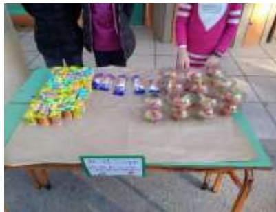
Εικόνα 2. Τέταρτο στάδιο πρωινού

Το τέταρτο στάδιο ήταν το πιο κρίσιμο του όλου εγχειρήματος. Το αριθμητικό σύνολο των προσφερόμενων μερίδων πάντοτε υπερκάλυπτε κατά πολύ το συνολικό αριθμό των μαθητών/τριών του σχολείου. Αντικειμενικός στόχος μας ήταν να καταναλωθούν όλα τα φαγητά. Έτσι, οι μαθητές/τριες της τάξης προσπαθούσαν με τη βοήθεια των εθελοντών γονιών και των εκπαιδευτικών να τα προωθήσουν στους/στις συμμαθητές/τριές τους. Στην επιτυχή έκβαση της διαδικασίας βοήθησε η τήρηση της σειράς, οπότε ελεγχόταν ποιος πήρε τι. Επίσης με αυτόν τον τρόπο είχαμε τον περιορισμό της κατανάλωσης μιας μερίδας από κάθε προσφερόμενο φαγητό ανά άτομο.