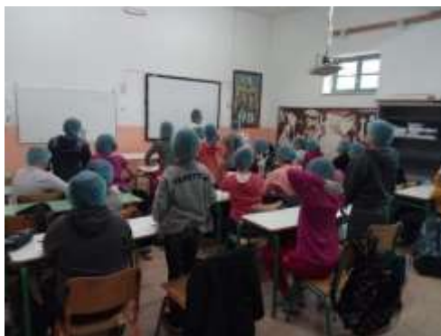
Εικόνα 1. Πρώτο στάδιο πρωινού