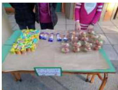
Εικόνα 2. Τέταρτο στάδιο πρωινού

Το τέταρτο στάδιο ήταν το πιο κρίσιμο του όλου εγχειρήματος. Το αριθμητικό σύνολο των προσφερόμενων μερίδων πάντοτε υπερκάλυπτε κατά πολύ το συνολικό αριθμό των μαθητών/τριών του σχολείου. Αντικειμενικός στόχος μας ήταν να καταναλωθούν όλα τα φαγητά. Έτσι, οι μαθητές/τριες της τάξης προσπαθούσαν με τη βοήθεια των εθελοντών γονιών και των εκπαιδευτικών να τα προωθήσουν στους/στις συμμαθητές/τριές τους. Στην επιτυχή έκβαση της διαδικασίας βοήθησε η τήρηση της σειράς, οπότε ελεγχόταν ποιος πήρε τι. Επίσης με αυτόν τον τρόπο είχαμε τον περιορισμό της κατανάλωσης μιας μερίδας από κάθε προσφερόμενο φαγητό ανά άτομο.