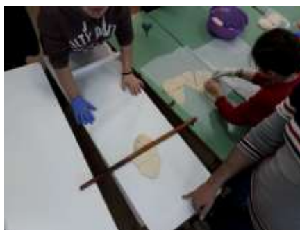
Εικόνα 2. Δεύτερο στάδιο πρωινού

Οι μαθητές/τριες μαζί με τη δασκάλα του Τ.Ε. και τον/τη δάσκαλο/α της τάξης επέλεξαν ποια φαγητά θα πρόσφεραν για πρωινό στο σχολείο. Τα παιδιά, χωρισμένα σε ομάδες, με τη βοήθεια των εκπαιδευτικών ετοίμαζαν τα φαγητά στο σχολείο. Μ' αυτόν τον τρόπο ήρθαν σ' επαφή με τα υλικά, έμαθαν να τα δουλεύουν, εξοικειώθηκαν με την υγιεινή διατροφή και τη μαγειρική, πήραν πρωτοβουλίες κι εξασκήθηκαν στη συνεργασία.