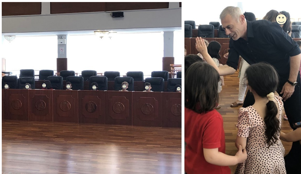
Εικόνα 2: Η συμμετοχή του 29 ου Νηπιαγωγείου Πειραιά στο Δημοτικό Συμβούλιο

καταγραφής και χαρτογράφησαν τη γειτονιά με βάση τα ευρήματά τους (ενδεικτικά, ασφαλή σημεία ο μεγάλος πεζόδρομος, το σήμα parking αναπήρων, και επικίνδυνα σημεία, κάποια αυτοκόλλητα πάνω σε σήματα οδικής κυκλοφορίας, παρκαρισμένα αυτοκίνητα σε διαβάσεις και κάποιες σπασμένες πλάκες πεζοδρομίου). Επιδιώκοντας να εντάξουν και άλλες οπτικές για την κατανόηση του ζητήματος, κάλεσαν εκπροσώπους της Τροχαίας, που τους παρείχαν χρήσιμες πληροφορίες για τη δράση τους, όπως ότι τη μέριμνα για την ασφάλεια των δρόμων της γειτονιάς έχει ο Δήμος. Αναλαμβάνοντας δράση στον κύκλο της πόλης, κατέγραψαν τα αιτήματά τους και απευθύνθηκαν στον Δήμαρχο Πειραιά, ο οποίος κάλεσε τα παιδιά να συμμετάσχουν σε ένα πολύ ενδιαφέρον και πρωτότυπο δημοτικό συμβούλιο (Εικ. 2) για το οποίο εκδόθηκε δελτίο τύπου, συμβάλλοντας στην κοινοποίηση των αιτημάτων και της οργανωμένης δράσης των παιδιών στην πόλη ( https://piraeus.gov.gr/2023/06/11/mia-ksechwrsth-synedriash-sthn-aitousa-dimotikou-symvoulou-me-ta-paidia-tou-29ou-nhpiagwgeiou/ )