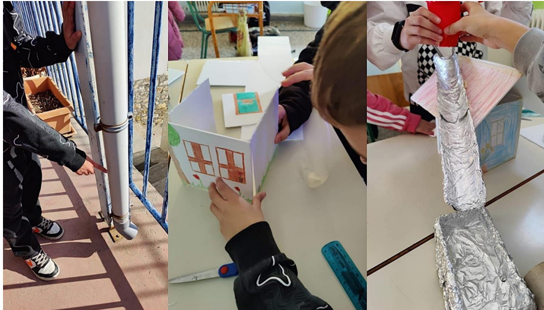
Εικόνα 3: Ενδεικτικά στιγμιότυπα από τη δράση κατασκευής συστήματος συλλογής και καθαρισμού βρόχινου νερού