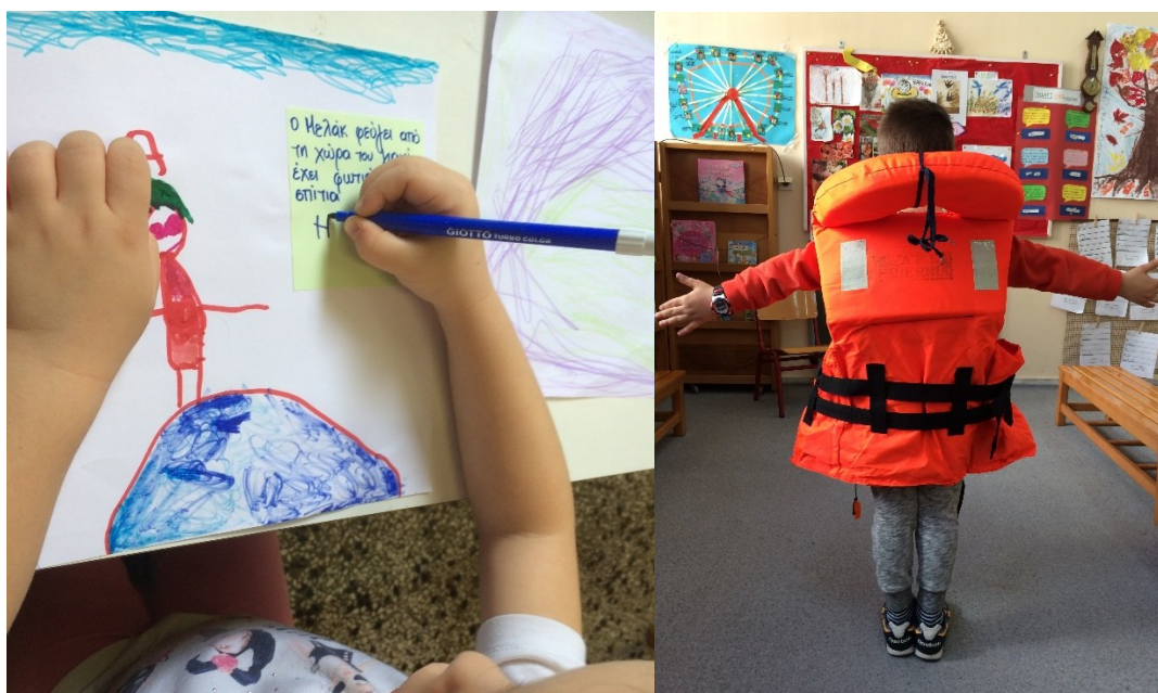
Εικόνα 4: Η κινησιολογική αναπαράσταση των συναισθημάτων ενός πρόσφυγα που υποχρεώνεται να εγκαταλείψει τη χώρα του, με βάση την εικόνα της ζωγραφιάς

Τα δύο τελευταία στάδια καθοδηγήθηκαν από τη δομή της παγκόσμιας ρουτίνας σκέψης «Τα 3 Γιατί» που λειτούργησε ως ένα εργαλείο στοχασμού σε τοπικό, εθνικό και παγκόσμιο επίπεδο (Boix-Mansilla, 2016). Τα παιδιά κλήθηκαν να λάβουν αποτελεσματικές αποφάσεις για την επιλογή των μέσων σύνθεσης, ψηφιοποίησης και διαμοιρασμού της ιστορίας. Ενδεικτικά μία από τις αποφάσεις που έλαβαν (απαντώντας στο τρίτο ερώτημα της ρουτίνας «Γιατί είναι σημαντικό για τον κόσμο»), ήταν η ψηφιακή ιστορία να μην έχει λόγια, ώστε να μπορούν να την κατανοήσουν παιδιά της περιοχής τους αλλά και παιδιά από άλλες χώρες του κόσμου που δεν γνωρίζουν ελληνικά.