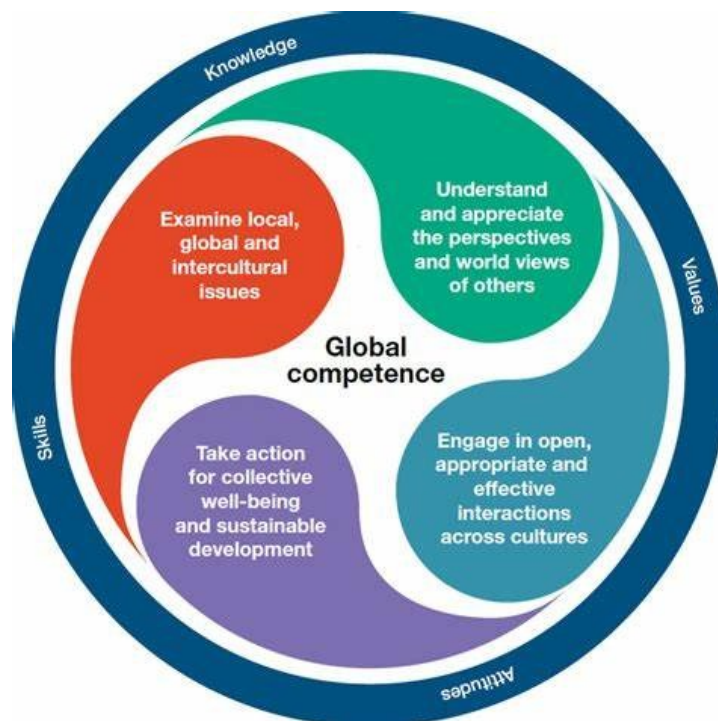
Εικόνα 1: Το μοντέλο τεσσάρων διαστάσεων της ικανότητας του παγκόσμιου πολίτη του ΟΟΣΑ

Στο πλαίσιο αυτό, ο Ο.Ο.Σ.Α. αξιοποιώντας τα αποτελέσματα της αξιολόγησης του διεθνούς προγράμματος PISA, καθώς και συστάσεις παγκόσμιων οργανισμών αναφορικά με τη δημοκρατική πολισιότητα και τη διαπολιτισμική εκπαίδευση (Council of Europe, 2016· UNESCO, 2014) πρότείνει ένα μοντέλο που προσδιορίζει την ικανότητα του παγκόσμιου πολίτη μέσα από τις ακόλουθες τέσσερις διαστάσεις (Piacentini κ.ά., 2018): (α) διερεύνηση τοπικών, παγκόσμιων και διαπολιτισμικών ζητημάτων, (β) εκτίμηση των διαφορετικών πεποιθήσεων και κατανόηση των παγκόσμιων προβλημάτων μέσα από διαφορετικές οπτικές, (γ) εμπλοκή και αποτελεσματική επικοινωνία σε γεωγραφικά, πολιτισμικά και γλωσσικά ποικιλόμορφα περιβάλλοντα, και (δ) ανάληψη συλλογικής δράσης για έναν δίκαιο και αειφόρο κόσμο. Το μοντέλο αυτό (Εικ. 1) στοχεύει να διευκολύνει τη συναντίληψη της διεθνούς εκπαιδευτικής πολιτικής σχετικά με το προφίλ του παγκόσμιου ενεργού πολίτη και ταυτόχρονα επιχειρεί να αποτελέσει ένα πλαίσιο αναφοράς των ψυχοκοινωνικών πόρων που χρειάζεται να ενεργοποιηθούν μέσω της εκπαίδευσης προκειμένου οι μαθητές/τριες να είναι ικανοί να ανταποκριθούν αποτελεσματικά στις παγκόσμιες προκλήσεις.