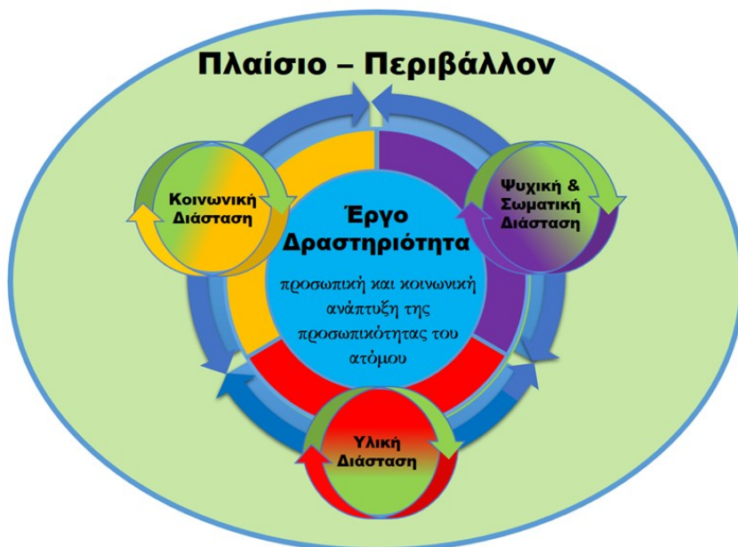
Σχήμα 1: μοντέλο Ποιότητας Έργου – Ζωής

Το Μοντέλο Ποιότητας Έργου – Ζωής: Μία εργοκεντρική προσέγγιση της Ποιότητας Ζωής