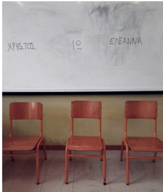
Εικόνα 2: «Ανακριτικές καρέκλες»

σταματήσει με επιχειρήματα και συνηγορεί στην σημασία της παρέμβασης των παρατηρητών.