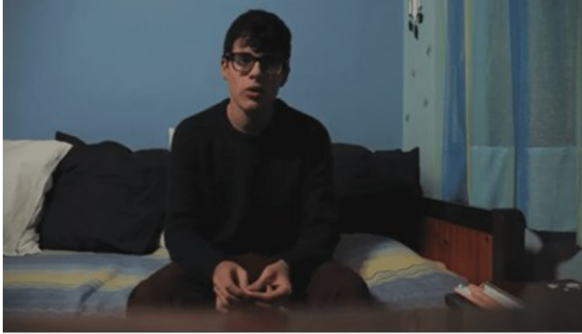
Εικόνα 1: Θεατής στο σενάριο από το Χαμόγελο του Παιδιού

Στην πρώτη περίπτωση, έχοντας αναγράψει τις απαντήσεις τους για τις σκέψεις και τα συναισθήματα των ηρώων/ίδων των εικόνων στον διαδραστικό πίνακα ή στον Η/Υ από τον οποίον προβαλλόταν η εικόνα, παρατάχθηκαν τρεις ή τέσσερις καρτέλες μπροστά στον πίνακα. Σε αυτές, τρία ή τέσσερα παιδιά με δική τους εθελοντική πρωτοβουλία, πήραν τους ρόλους του θύτη, του θύματος και ενός ατόμου που παρατηρεί τον εκφοβισμό. Το άτομο αυτό μπορεί να φαίνεται ότι προβληματίζεται για την κατάσταση και μπορεί να υπάρχει και ένα άτομο που υποστηρίζει τον θύτη (ανάλογα με τον διαθέσιμο χρόνο). Η κατ' ιδίαν οδηγία προς τους «ήρωες/ίδες» ήταν να υποστηρίξουν τη θέση τους όσο μπορούν και στα παιδιά της υπόλοιπης τάξης ήταν να τους θέσουν όποια ερώτηση θέλουν που να αφορά στην κατάσταση και να γίνει διάλογος.