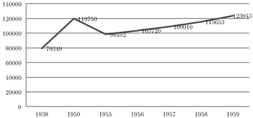
Γράφημα 2. Καλλιέργειες σουλτανίνας σε χιλιάδες στρέμματα στην Κρήτη, 1938-1959