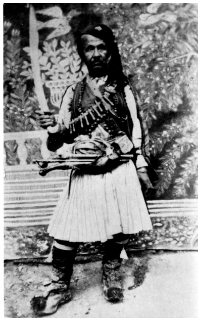
Εικ. 2. Φωτογραφία του Θεόφιλου στον κατάλογο της έκθεσης: Théophilos peintre populaire grec , επιμέλεια: François Mathey, Musée des Arts Décoratifs, Παρίσι 1961, χ.α.