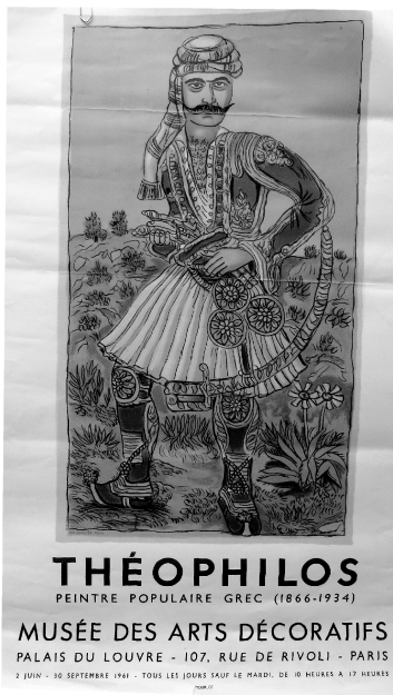
Εικ. 1. Αφίσα της έκθεσης Théophilos peintre populaire grec , Μουσείο Διακοσμητικών Τεχνών, Παρίσι, 1961, Αρχείο Tériade στο Παρίσι, ευγενική παραχώρηση.