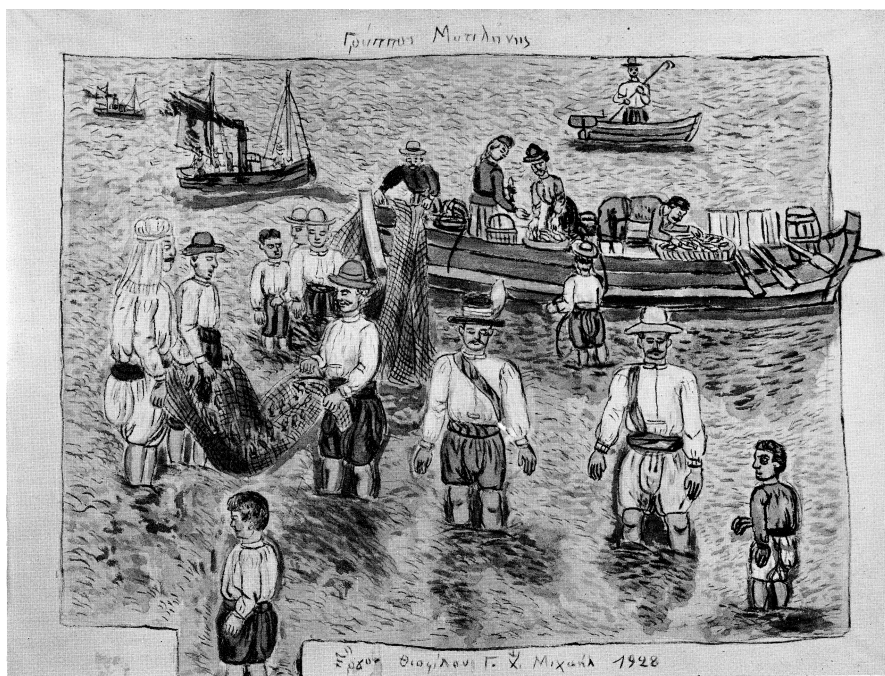
Εικ. 4. Θεόφιλος Χατζημεγάλ, Γρούππος Μυτιλήνης , 1928, αναπαράγωγή στον κατάλογο της έκθεσης Der griechische Bauernmaler Theophilus , επιμέλεια: Franz Meyer, Kunsthalle Bern, Βέρνη 1960, χ.α.

τόσο στο επίπεδο της μορφής του αγοριού κάτω αριστερά, όσο και στο ύψος της πρύμνης της κεντρικής λέμβου πάνω δεξιά. Σύμφωνα με τον Meyer, η κεντρόφυγη αυτή τάση της σύνθεσης αποτελεί ένα από τα βασικά χαρακτηριστικά που διακρίνουν την τέχνη του Θεόφιλου από αυτήν των δυτικοευρωπαίων πριμιτίφ. Ο διευθυντής της Kunsthalle την συνδέει τόσο με την τεράστια εξοικείωση του Θεόφιλου με τις μεγάλες επιφάνειες της ζωγραφικής τοίχου όσο και με τη σχέση οικειότητας με το κοινό του. Σε μια απόπειρα κοινωνιο-ψυχολογικής ερμηνείας, ο Meyer παρατηρεί ότι ο Θεόφιλος απευθύνεται σ' ένα γνώριμο και υπαρκτό κοινό, σε αντίθεση με την κοινωνική απομόνωση δυτικοευρωπαίων αυτοδίδακτων, πολλοί από τους οποίους κατέληξαν να ζωγραφίζουν αποκλειστικά για