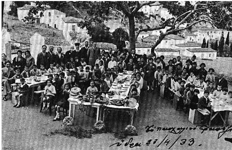
Υπαιθριο μαθητικό συσσίτιο στην Ύδρα

(Και οι δύο εικόνες από το βιβλίο του Εμμανουήλ Λαμπαδάριου, Σχολική Υγιεινή μετά στοιχείων Παιδολογίας , εκδ. γ', Αθήνα 1934, σ. 354 και 196 αντίστοιχα)