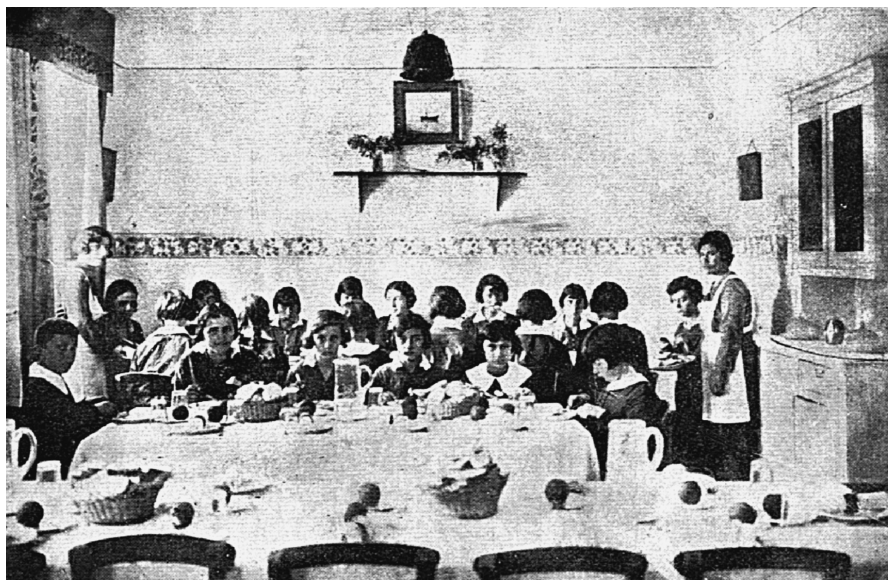
Μαθητικό συσσίτιο δημοτικού σχολείου στην Αθήνα