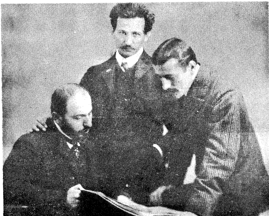
Σκληρός, Δελμούζος, Τριανταφυλλίδης, στην Ίενα (1907).