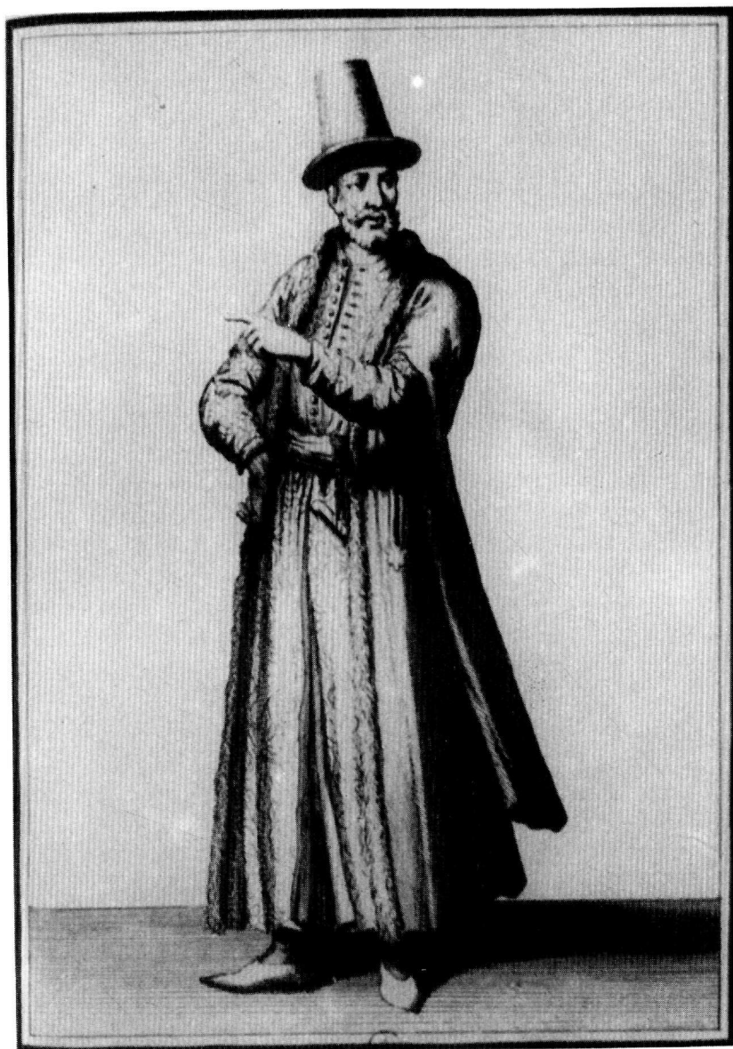
Έλληνας εύγενής (Σπ. Ἀσδραχὰς [ἐπιμ. ἔκδ.], Ἡ οἰκονομικὴ δομὴ τῶν βαλκανικῶν χωρῶν (15ος-19ος αἰώνας) , Ἀθήνα, Μέλισσα, 1979, πίν. 56)