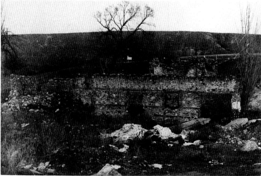
Γενική άποψη του αλευρόμυλου Β' στο Γραδεμπόριο