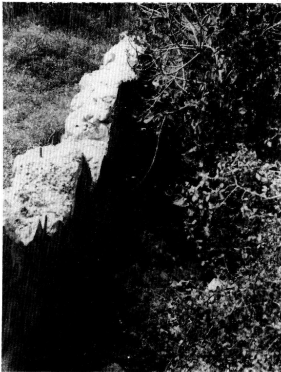
Ο μύλος στο Üs Hanlar