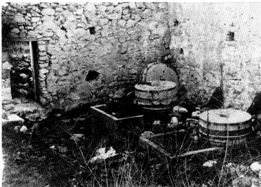
Οι μυλόπετρες του αλευρόμυλου Α' στο Γραδεμπόριο