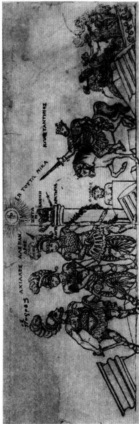
Ίχνογράφημα 'Α. Ίατριδῆ (Ἀθήνα, Ἐθνικὸ Ἱστορικὸ Μουσεῖο)