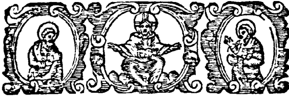
Ἀπό τὴν εἰκονογράφηση τῆς Ὀκτωήχου τοῦ 1674

Γραδενίγου». Γνωρίζουμε, πράγματι, τρεῖς τουλάχιστον περιπτώσεις ἐκδόσεων τοῦ Γλυκῆ, ὅπου τὸ ὄνομα τοῦ Γραδενίγου ἀναγράφεται σὲ ἓνα, μόνο, τμήμα τῶν ἀντιτύπων ποὺ κυκλοφόρησαν. Εἶναι : τὸ Θεῖον καὶ Ἱερὸν Εὐαγγέλιον , ἐκδοση Γλυκῆ τοῦ 1671, ποὺ κυκλοφόρησε μὲ ἀντίτυπα στὰ ὁποῖα δὲν ἀναγράφεται ὄνομα διορθωτῆ 10 καὶ ἄλλα στὰ ὁποῖα ἔχει προστεθεῖ, στὸ τέλος τοῦ τόμου, ἡ ἐνδειξη «Διορθῶσει τοῦ Λογιωτάτου Γραδενίγου Βιβλιοφύλακος» 11 . τὸ Εὐαγγελιστάριον , ἐκδοση Γλυκῆ, ἐπίσης τοῦ 1671, τοῦ ὁποῖου γνωρίζουμε ἀντίτυπα χωρὶς ἀναγραφή ὀνόματος διορθωτῆ 12 καὶ ἄλλα μὲ ἐνδειξη: «Διορθῶσει τοῦ Λογιωτάτου Γραδενίγου Βιβλιοφύλακος» 13 . καί, τέλος, τὸ Βιβλίον τοῦ Ἰουλίου Μηνός , ἐκδοση Γλυκῆ τοῦ 1672, τῆς ὁποίας ὑπάρχουν ἀντίτυπα ὅπου δὲν σημειώνεται τὸ ὄνομα τοῦ