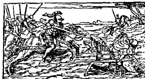
Ε'Ν ΕΤΗ ΣΙ, 1760. Παρά Ἀνατολῆν τῶν Βέρμων. CON LICENZA DE' SUPERIORI.