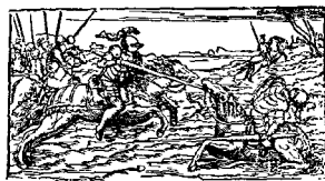
Ε'ΝΕΤΪΗΣΙ, 1760. Παρὰ Ἀγνοίᾳ τῶ Βόρμολι. CON LICENZA DE' SUPERIORI.