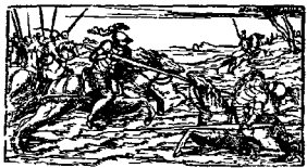
Ε'ΝΕΤΪΗΣΙ, 1760. Παρὰ Ἀγνοίᾳ τῶ Βόρμολι. CON LICENZA DE' SUPERIORI.