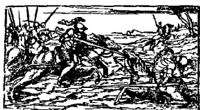
Ε'Ν ΕΤΗ ΣΙ, 1760. Παρά Ἀνατολῆν τῶν Βέρμων. CON LICENZA DE' SUPERIORI.