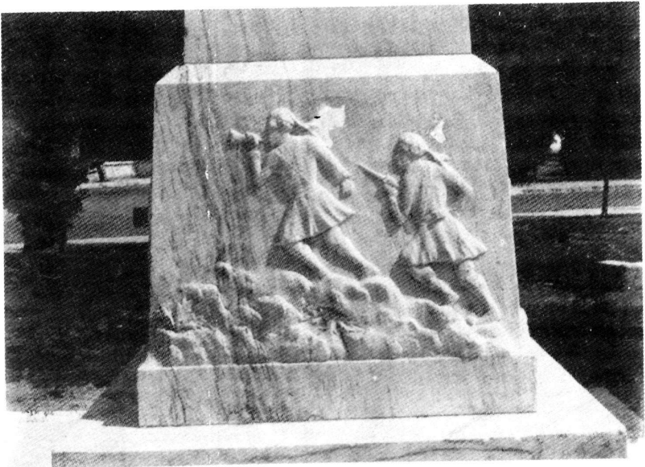
Ἐπίψεις τοῦ Ἡρώου Παϊανίας