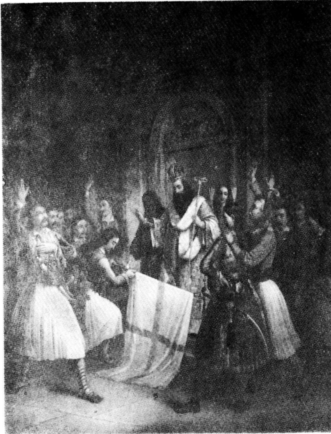
Έλαιογραφία του Θεοδ. Βουζάκη, έτος 1840 - Μουσείον Μπενάκη - Αθήνα