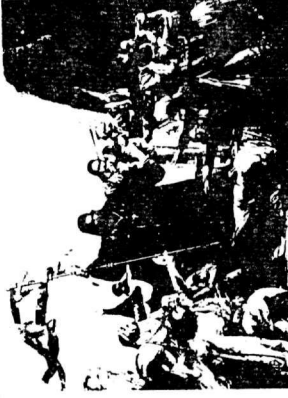
Εικόνα 1. Ο Γεώργιος Κολοκοτρώνης, ο Παλαιών Πατρών Γερμανός κήρυξε την Επανάσταση του 1821 στο Μοναστήρι της Αγίας Λαύρας.

Εικόνα 2. Το φύλλο της εφ. Η Φωνή των Καλαβρύτων, όπου αναδημοσιεύτηκε το κείμενο από την εφ. Le Constitutionnel.