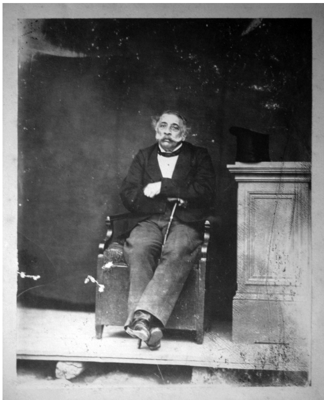
Εικ. 2: Φίλιππος Μαργαρίτης, Ο Αλέξανδρος Μαυροκορδάτος, 1849-1852 π., Αθήνα, 21×16.3 εκ., Χαρτί άλματος, Ε.Π.Μ.Α.Σ.