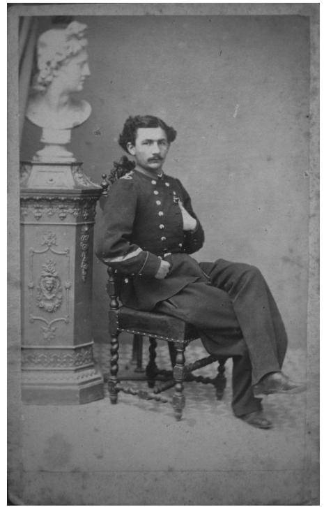
Εικ. 14: Πέτρος Μωραΐτης, Προσωπογραφία ένστολου άνδρα, Αθήνα, 1860 π., cdv, Συλλογή Νίκου Πολίτη.