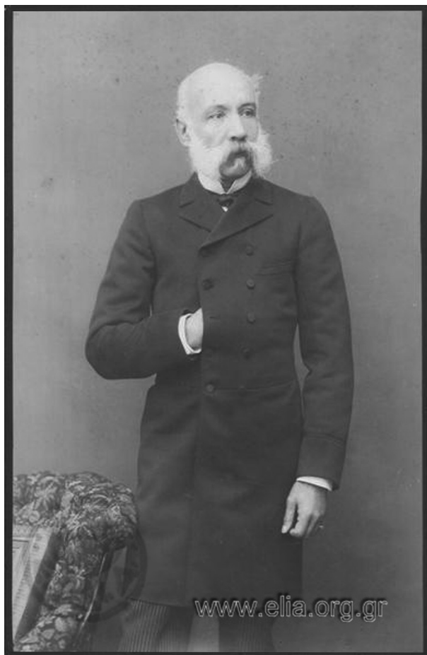
Εικ. 12: Πέτρος Μωραΐτης, Θ. Δηλιγιάννης, Αθήνα, 1886 π., salon, Ε.Λ.Ι.Α.

Από τη δεκαετία του 1870, κυρίως, και εξής, με την εισροή στη χώρα ομογενών παλινοστούτων, οι οποίοι μετέδωσαν έναν αέρα κοσμοπολιτισμού και ευμάρειας στην ελληνική, αθηναϊκή κατά κύριο λόγο, κοινωνική ζωή, η φωτογραφική προσωπογραφία θα δεχθεί νέα δυναμική ώθηση. Ήδη από τη δεκαετία του 1860, οι ευπορότεροι πελάτες είχαν αρχίσει να επισκέπτονται περισσότερα του ενός φωτογραφικά πλατό δοκιμάζοντας νέες πόζες και σκηηνικά. Ένα