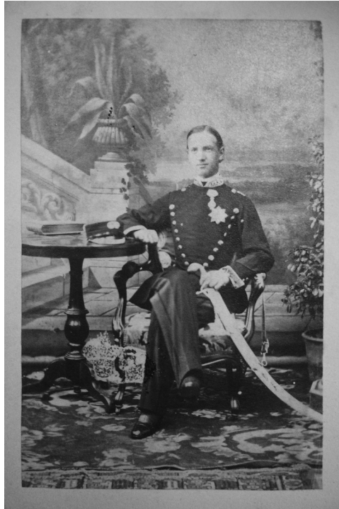
Εικ. 11: Πέτρος Μωραΐτης, Ο Γεώργιος Α', Αθήνα, 1865 π., cdv, Ε.Π.Μ.Α.Σ.

γνώσεις όσο και με την τεχνική του επάρκεια. Σημειώνουμε ότι οι προσωπογραφίες δημόσιων προσώπων, όπως, για παράδειγμα, των μελών της βασιλικής οικογένειας, πρωθυπουργών, διοικητών κτλ., παρέχουν τη δυνατότητα να εξακριβωθεί η αρτιότητα και συνθετική δεινότητα διάσημων φωτογράφων, όπως του Π. Μωραΐτη, καθώς οι εν λόγω συνθέσεις υλοποιούνταν σχεδόν κατ' αποκλειστικότητα από τους ίδιους τους φωτογράφους και όχι από τον ή τους βοηθούς τους, σε αντίθεση δηλαδή με ό,τι συνηθιζόταν την εποχή εκείνη σε φωτογραφεία με μεγάλο πελατολόγιο. 80