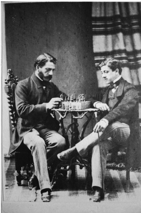
Εικ. 15: Ανώνυμος, [αποδ. Ξ. Βάθης & Αθ. Κάλφας], Σκακιστές, [Αθήνα], 1861 π., cdv.