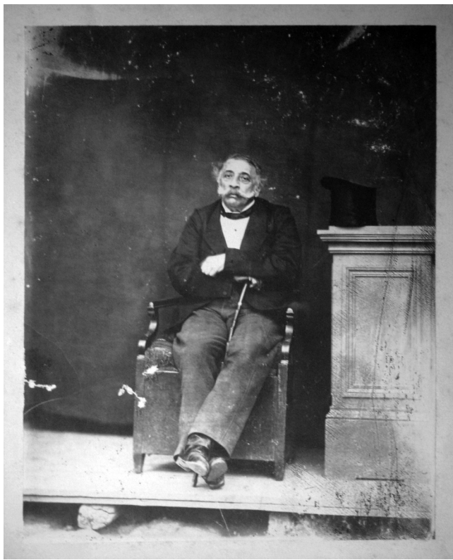
Εικ. 2: Φίλιππος Μαργαρίτης, Ο Αλέξανδρος Μαυροκορδάτος, 1849-1852 π., Αθήνα, 21×16.3 εκ., Χαρτί άλατος, Ε.Π.Μ.Α.Σ.