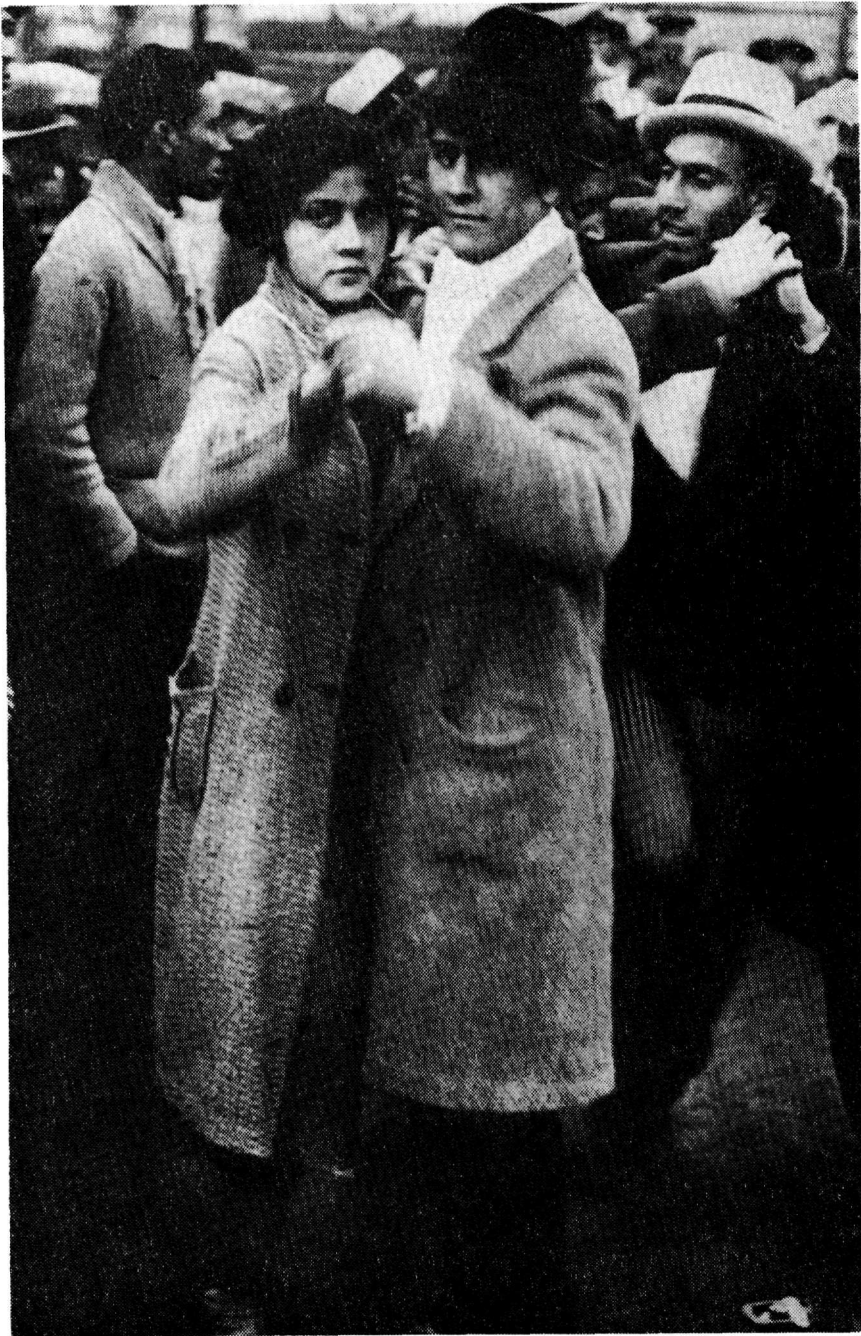
Tango σε λαϊκή γιορτή στο Buenos Aires (δεκαετία 1930)