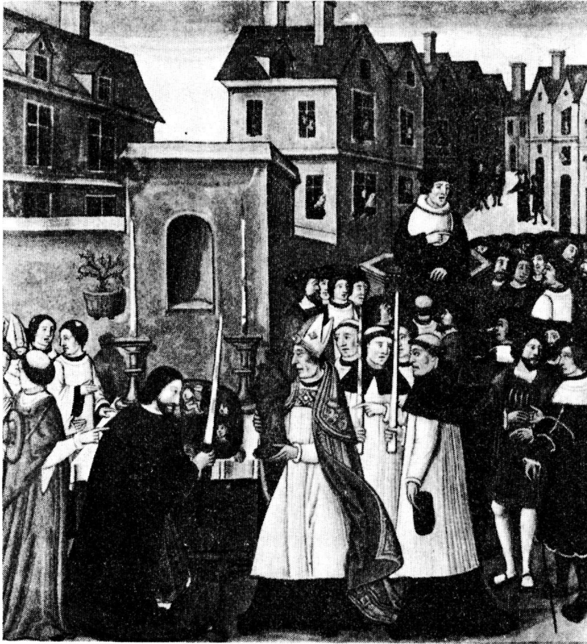
Παρίσι 1528. Λιτανεία με τη συμμετοχή του Φραγκίσκου Α' για την αποκατάσταση βεβηλωμένου αγάλματος της Παρθένου Μαρίας