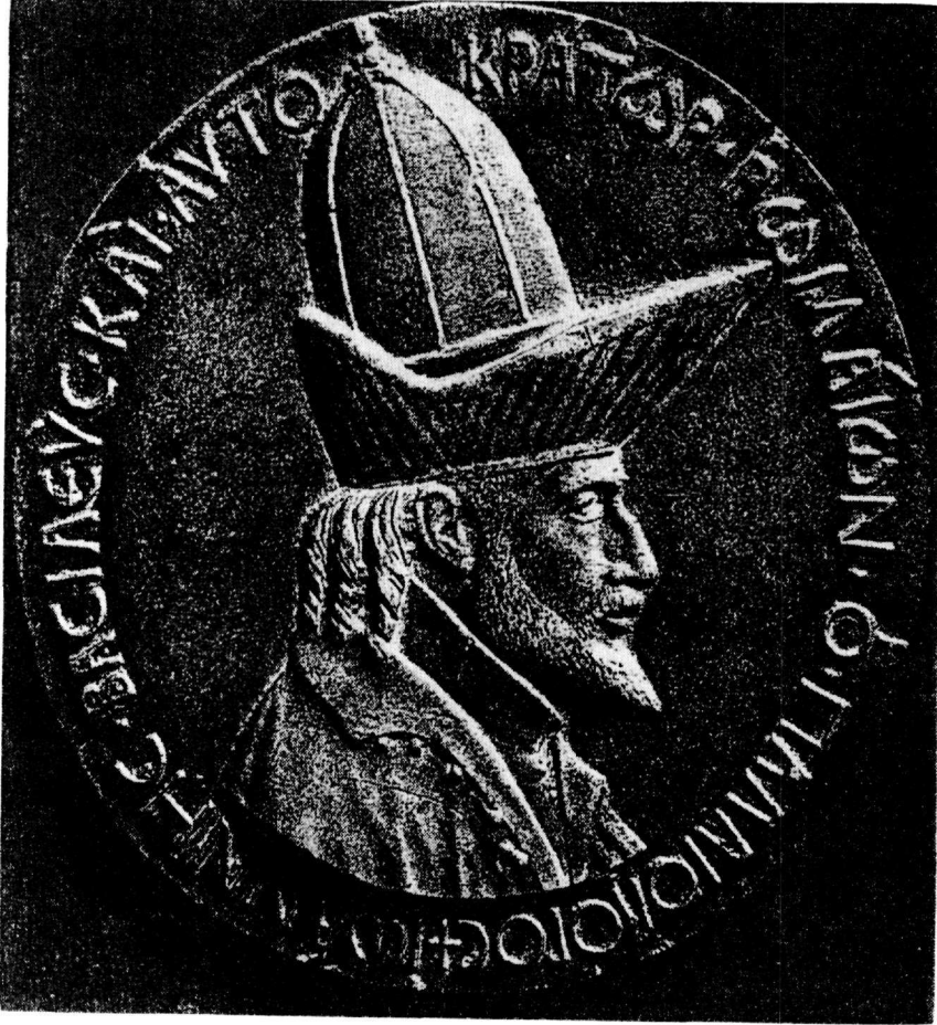
‘Ο Ιωάννης Η΄ ο Παλαιολόγος σὲ μετάλλιο τοῦ Pisanello (Museo del Bargello, Φλωρεντία)