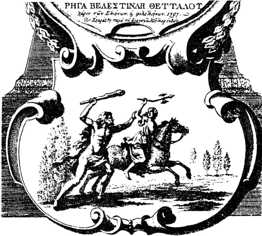
Λεπτομέρεια της προμετωπίδας της Χάρτας του Ρήγα. Ο Ηρακλής κυνηγά μια Αμαζόνα κραδαίνοντας ένα τεράστιο ρόπαλο