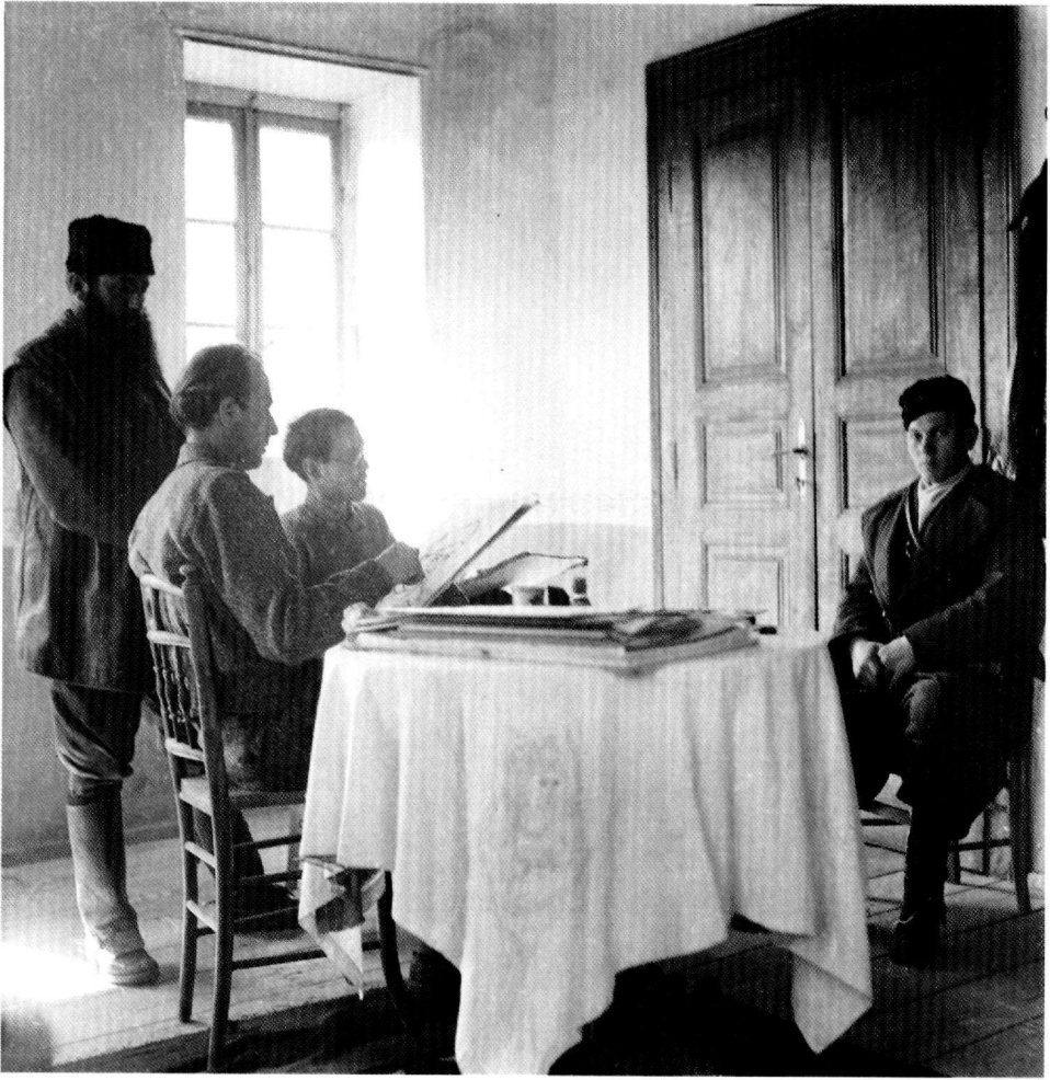
Ειχ.1: Σπύρος Μελετζής. Οι ζωγράφοι του Βουνού ζωγραφίζουν τον μαυροσκούφη Λέοντα. Ο Άρης Βελουχιώτης παρακολουθεί. Λαμία 1944.