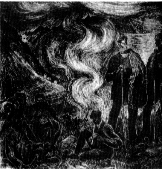
Εικ.5: Βάλιας Σεμερτζίδης, Φλογέρα του τσοπάνου. Χαρακτικό σε μέταλλο. Ο Σεμερτζίδης, στο Λεύκωμά του, χρονολογεί το έργο στην πενταετία από 1944, χρονιά που ανέβηκε στο Βουνό, έως 1949, που έδωσε την τελική μορφή.