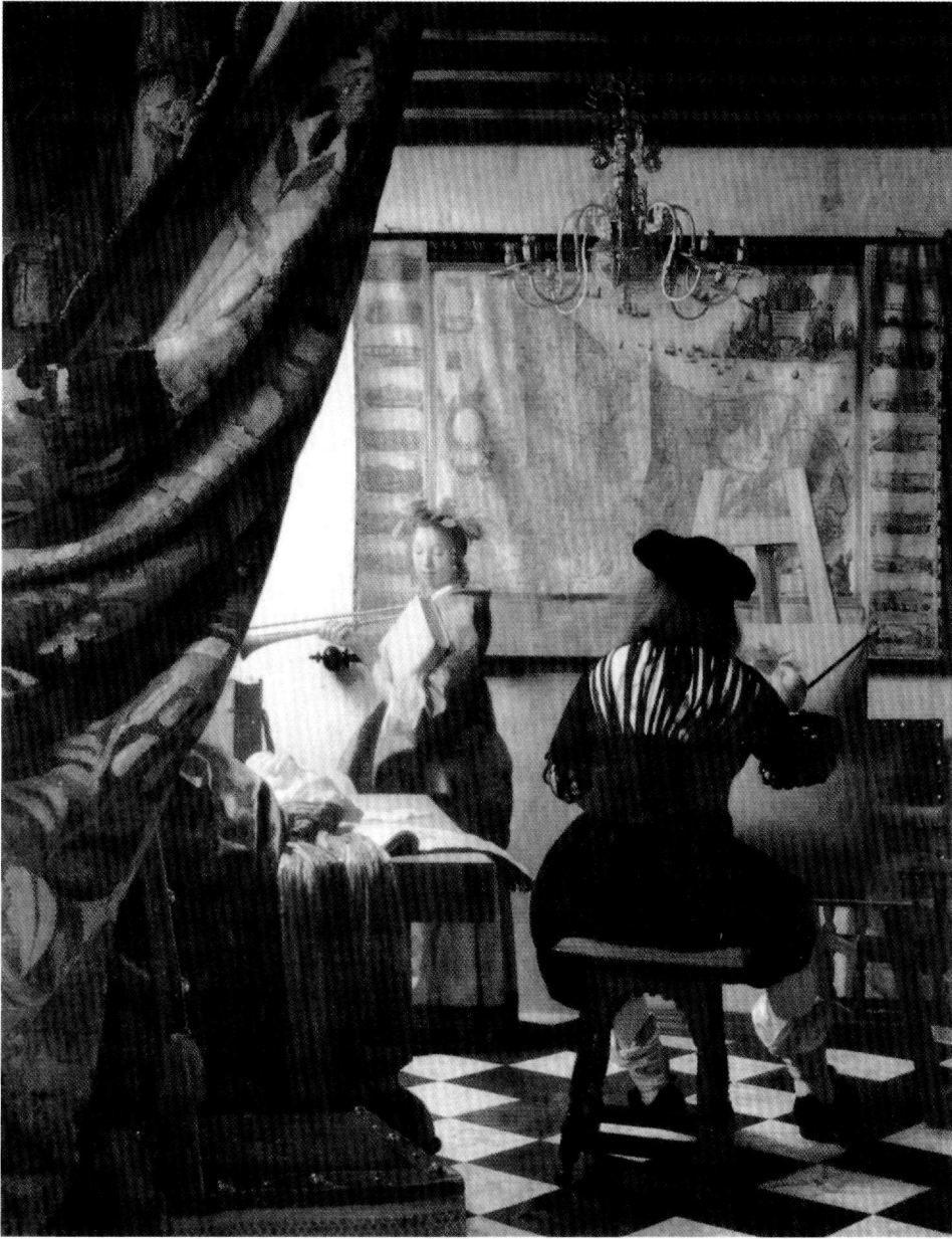
Εικ.6: Jan Vermeer. Η τέχνη της Ζωγραφικής. Βιέννη, Μουσείο Τέχνης