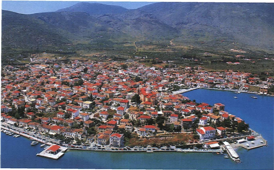
1. Γενική άποψη Γαλαξειδίου από ανατολικά (1990).