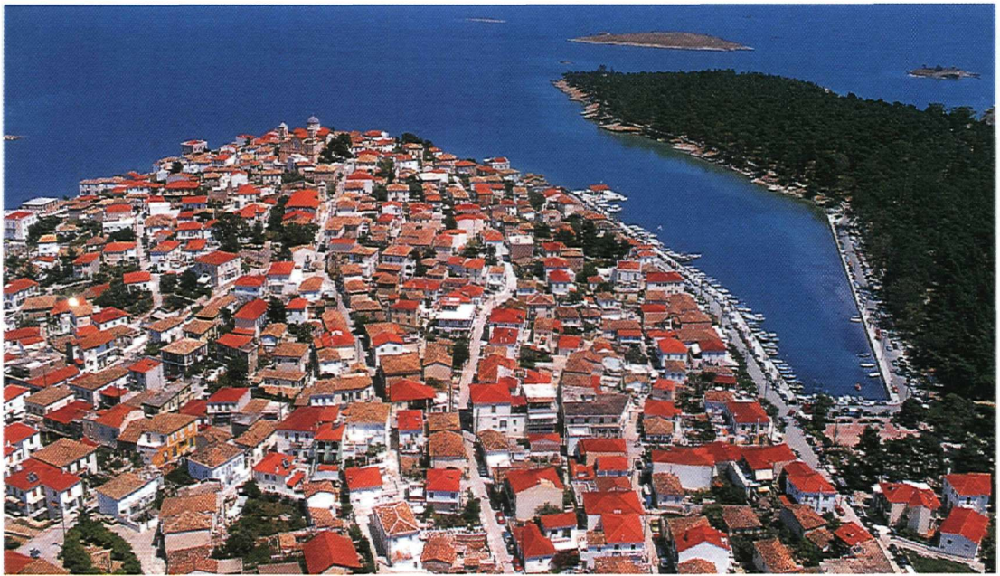
4. Γενική άποψη Γαλαξειδίου από νότια (1990).