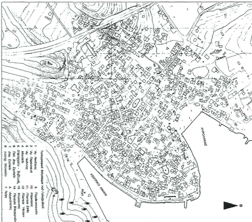
2. Τοπογραφικό διάγραμμα του Γαλαξειδίου.