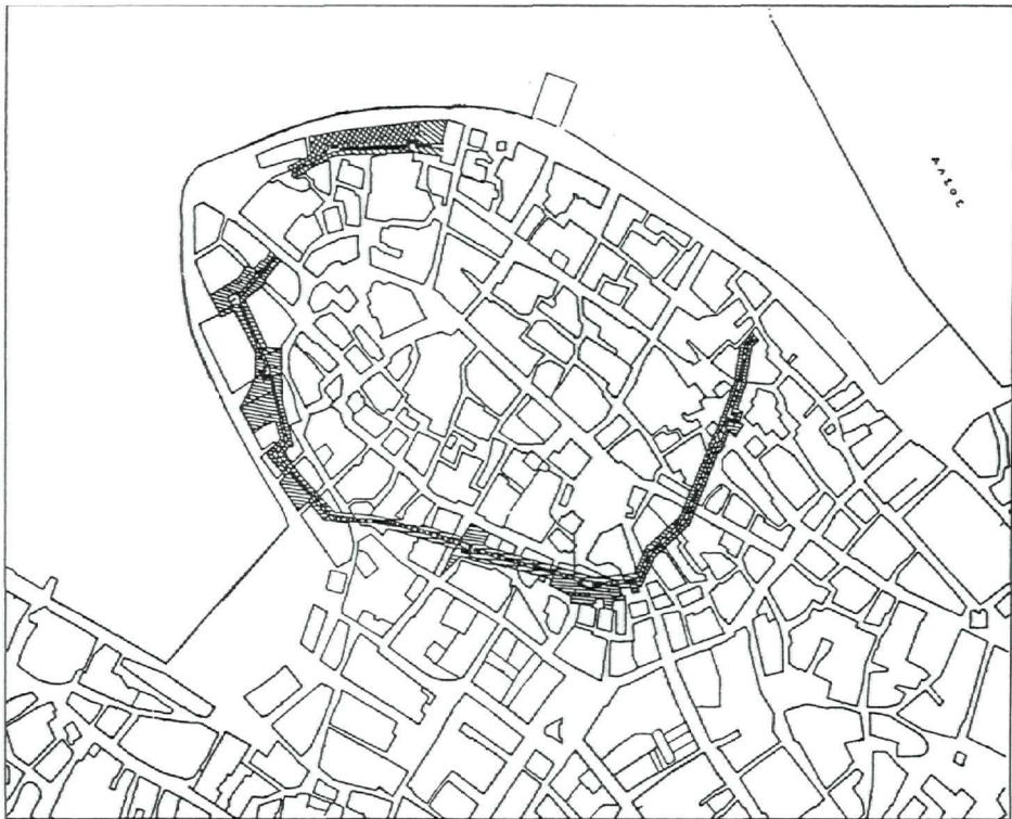
5. Τò περίγραμμα τού άρχαίου τείχους.