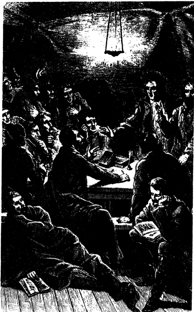
1. Συνεδρίαση σὲ βέντιτα Κομπονάρων (Χαρακτικό ἐποχῆς)