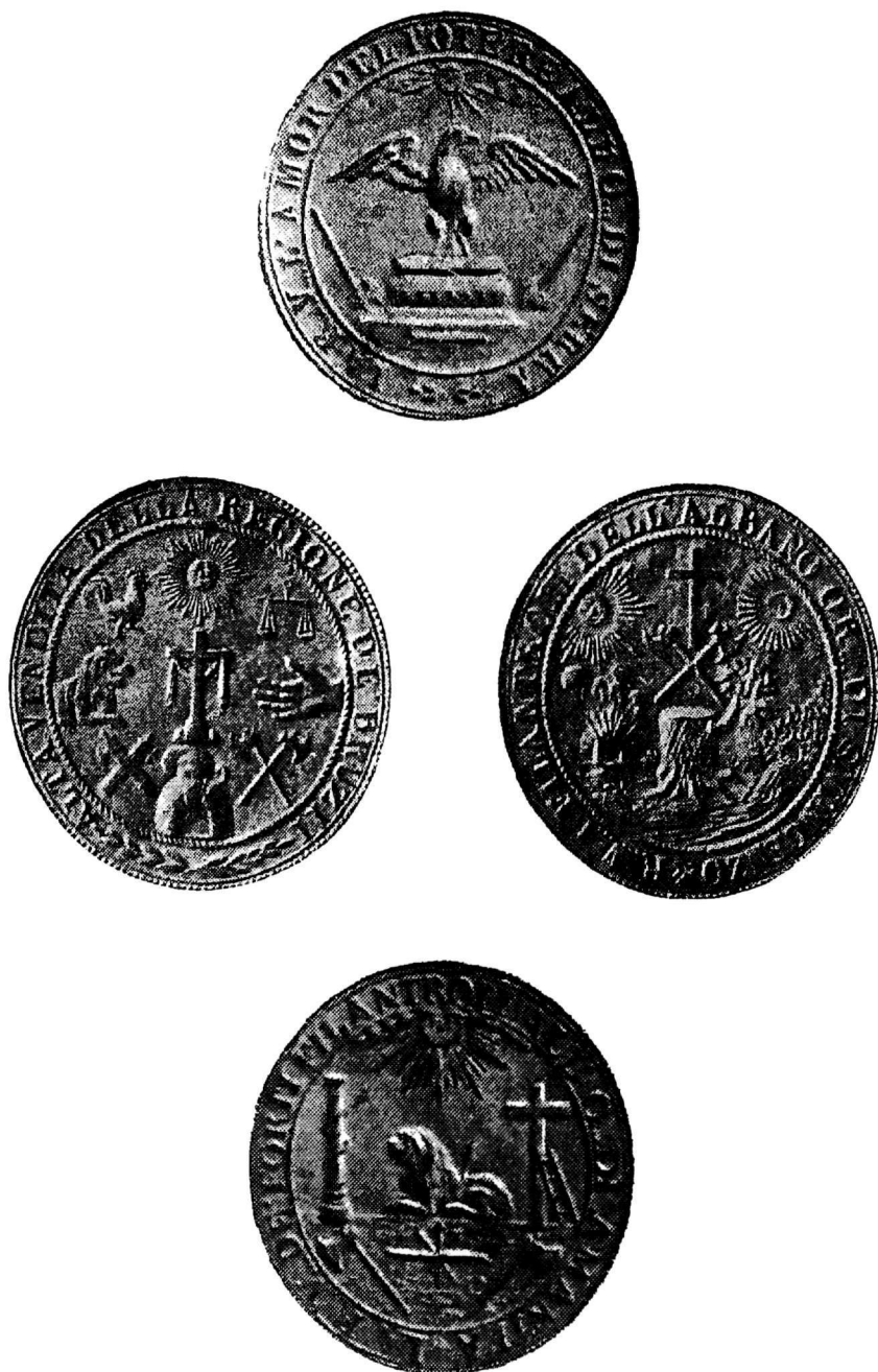
3. Σφραγίδες ἰταλῶν Καρμπονάρων

(Ἀπὸ τὸ βιβλίο τοῦ Oreste Dito, Carboneria ed altre società segrete nella storia del Risorgimento , Ρώμη - Τορίνο 1905)