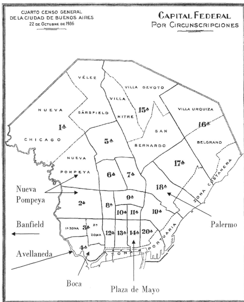
Πηγή: IV Censo Municipal de la ciudad de Buenos Aires, 1936, σ. 46.

Διοικητικές περιφέρειες του Μπουένος Άιρες, έτος 1914 και 1936