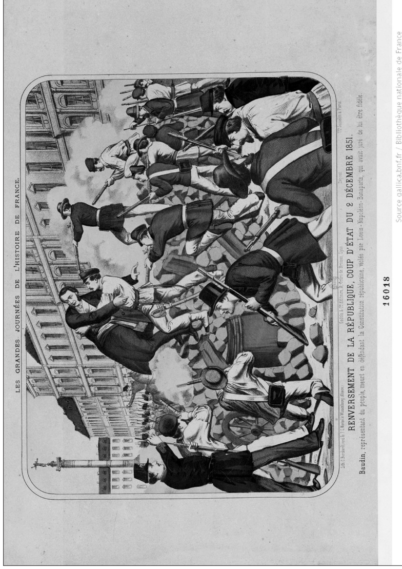
Εικ. 2: Ανατροπή της Δημοκρατίας, πραξικόπημα της 2 Δεκεμβρίου 1851. Ο Baudin, αντιπρόσωπος του λαού, πεθαίνει υπερασπιζόμενος το σύνταγμα της Δημοκρατίας, το οποίο παραβιάστηκε από τον Λουδοβίκο Βοναπάρτη που είχε ορκιστεί να είναι πιστός σ' αυτό. (Χρωμολιθογραφία)