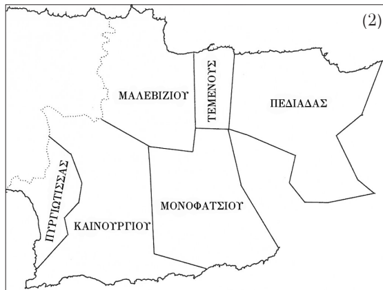
Χάρτης* 1, 2: Τα χωριά του ναχιγέ Μαλεβιζίου (1) και οι όμορες επαρχίες του (2).

* Ο Κώδικας των Θυσιών, επιμ. Βασίλης Δημητριάδης – Διονυσία Δασκάλου, Ηράκλειο 2003. Από τον αρχικό χάρτη του βιβλίου απουσίαζαν τα χωριά Νίση και Γάζι. Σήμερα το χωριό Νίση υπάρχει μόνο ως τοπωνύμιο, δεν κατοικείται. Αντιθέτως, το χωριό Γάζι ήταν και είναι ένα από τα μεγαλύτερα χωριά της επαρχίας (έδρα του σημερινού Δήμου Μαλεβιζίου). Για τον λόγο αυτό τα δύο χωριά προστέθηκαν εκ των υστέρων.