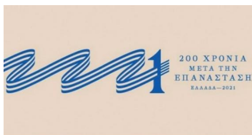
Figure 6 : Autre version de l'identité visuelle

Dans le second logotype, celui qui a été retenu (cf. Figure 3), le trait distinctif « drapeau » est éliminé, ce qui entraîne l'élimination de la valeur « nation » puisque sans la croix il n'y a plus le symbole global mais uniquement le contraste de la couleur 1 . Il s'agit d'un « contraste de la couleur en soi 2 ». S'il s'agit du contraste le plus simple, un contraste qui n'exige pas d'effort visuel, le bleu est parmi les couleurs les plus fortes de ce contraste. Même si ce n'est pas le même bleu dans les Figures 1 et 3, l'association du bleu avec le blanc affaiblit la luminosité du bleu, le rend plus terne (cf. Figure 3), tandis que l'association avec le noir augmente la luminosité du bleu (cf. Figure 1). Le bleu (comme le blanc) n'ayant ni la même force d'expression selon la composition déclinée ni la même force symbolique comme permet de le constater la composition suivante :