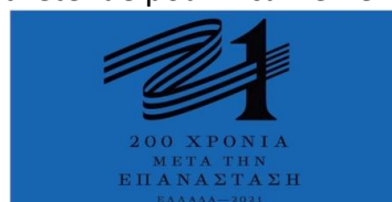
Figure 1 : Identité visuelle de la commémoration

Convoquer la commémoration au titre d'une mythification par l'identité visuelle, c'est postuler que l'image créée et retenue pour incarner le méta-événement :