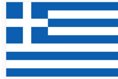
Figure 4 : Le drapeau grec

Le lien direct avec le drapeau n'ayant pas été retenu dans le processus de communication de la commémoration, comment l'identité visuelle choisie raconte la commémoration ?