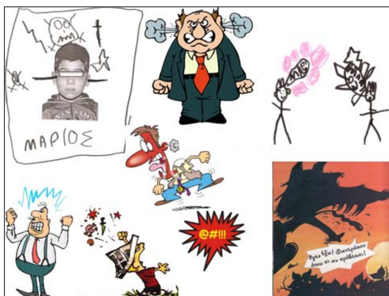
Εικόνα 4. Συμβάσεις των κόμικς για την απεικόνιση του θυμού.

Τα μπαλόνια των συναισθημάτων. Εκτός από τα έντονα μπαλόνια της οργής παρατηρούνται στα κόμικς και άλλες παραλλαγές, όπως για παράδειγμα της ψυχρότητας (μπαλόνια λόγων σχηματοποιημένα σε παγωμένα σύννεφα) ή της προσποιητής ευγένειας (μπαλόνια λόγων με περίγραμμα γιρλάντες λουλουδιών). Τα παιδιά προσθέτουν μπαλόνια λόγων ή σκέψεων σε ήρωες γνωστών τους ιστοριών και προσπαθούν να φανερώσουν τα συναισθήματα των χαρακτήρων με τον τρόπο που έχουν σχεδιάσει τα μπαλόνια. Για παράδειγμα, η λύπη της Σταχτοπούτας εκφράζεται με ένα μπαλόνι που μοιάζει με δάκρυ και ο διάλογός της με τον πρίγκιπα φιλοξενείται σε μπαλόνια-κατακόκκινες καρδιές, η χαρά της μαμάς της Κοκκινোসκουφίτσας για τη σωτηρία της κόρης της με ένα μπαλόνι-χαμόγελο, ενώ η απογοήτευση το λύκου που δεν κατάφερε να τη φάει με ένα μαύρο σύννεφο έτοιμο να φέρει δυνατή βροχή.