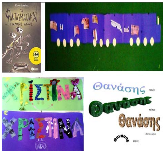
Εικόνα 6. Διαφορετικές γραμματοσειρές για τα συναισθήματα.

Τι νιώθω; Αφού τα παιδιά παρατηρήσουν τη μεγάλη ποικιλία με την οποία τα διάφορα συναισθήματα εγγράφονται στην εικόνα της γραπτής λέξης, τους ζητείται να κάνουν το ίδιο στην αναγραφή του ονόματός τους. Σε αυτήν την περίπτωση δίνονται δισδιάστατα γράμματα μέσα στα οποία τα παιδιά θα ζωγραφίσουν ό,τι τα κάνει να αισθάνονται έτσι (π.χ. βόλτες στη θάλασσα, καρδούλες και πολλά λουλούδια για τη χαρά, αλλά και νυχτερινό ουρανό, μάγισσες, νυχτερίδες, και δάκρυα για τη λύπη).