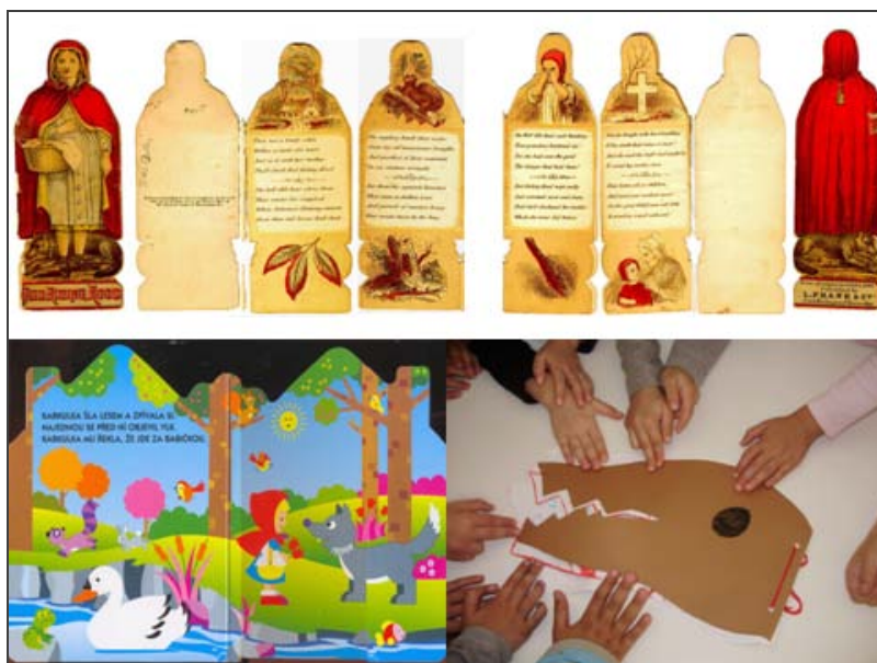
Εικόνα 5. Βιβλίο – περιγράμματα.

(Βοστώνη 1863, Lydia L. Very) σε βιβλίο-περίγραμμα της ομώνυμης ηρωίδας τοποθετεί την έμφαση στο κορίτσι και το σφάλμα της ανυπακοής, που έθεσε τον εαυτό της και τη γιαγιά της σε θανάσιμο κίνδυνο. Τα ίδια τα παιδιά όταν δημιούργησαν μια τρομαχτική εκδοχή της ιστορίας της Κοκκινοσκουφίτσας θεώρησαν ότι θα ταίριαζε καλύτερα σε ένα βιβλίο σε σχήμα ανοιχτού στόματος λύκου.