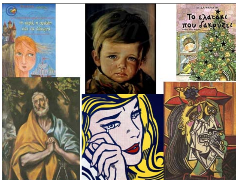
Εικόνα 3. Τα δακρυσμένα πορτρέτα.

Ποιο ταιριάζει. Με αφορμή κάποιο βιβλίο, π.χ. Ο Θυμωμένος Αρθουρ , τα παιδιά προσπαθούν από μια σειρά απλών σκίτσων που παριστάνουν σε αδρότατες γραμμές κάποιες συναισθηματικές καταστάσεις (π.χ. emoticons < emotions + icons ) να ανακαλύψουν εκείνο που απεικονίζει το συναίσθημα του βιβλίου. Έτσι μαθαίνουν να διαβάζουν αφαιρετικές εικόνες και να κατανοούν τις βασικές συμβάσεις απεικόνισης των συναισθημάτων.