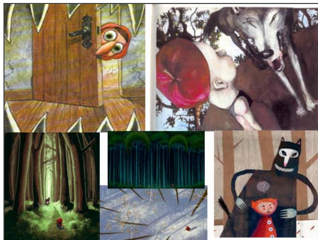
Εικόνα 1. Το σκηνικό του τρόμου.

Τρομόμετρο. Συχνά τα παιδιά έρχονται σε επαφή στα βιβλία τους με φοβικά ερεθίσματα, χαρακτήρες ή σκηνές. Η σχετική εικονογράφηση έχει τη δυνατότητα να δημιουργήσει την αίσθηση φόβου, να την απαλύνει ή ακόμη και να την εξουδετερώσει ολοκληρωτικά. Τα παιδιά συγκεντρώνουν εικόνες από την ίδια ιστορία και τις ταξινομούν με κριτήριο το φόβο που προκαλούν. Ενδιαφέρον παρουσιάζει ο λύκος που στις διαφορετικές του εκδοχές μπορεί να γίνει από άγριος και τρομαχτικός μέχρι ευχάριστος ή ... γελοίος.