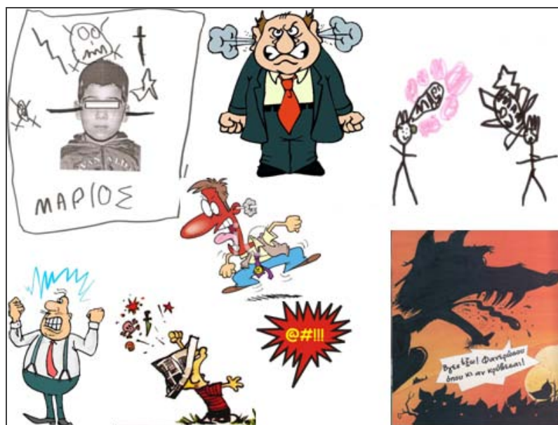
Εικόνα 4. Συμβάσεις των κόμικς για την απεικόνιση του θυμού.

Τα μπαλόνια των συναισθημάτων. Εκτός από τα έντονα μπαλόνια της οργής παρατηρούνται στα κόμικς και άλλες παραλλαγές, όπως για παράδειγμα της ψυχρότητας (μπαλόνια λόγων σχηματοποιημένα σε παγωμένα σύννεφα) ή της προσποιητής ευγένειας (μπαλόνια λόγων με περίγραμμα γιρλάντες λουλουδιών). Τα παιδιά προσθέτουν μπαλόνια λόγων ή σκέψεων σε ήρωες γνωστών τους ιστοριών και προσπαθούν να φανερώσουν τα συναισθήματα των χαρακτήρων με τον τρόπο που έχουν σχεδιάσει τα μπαλόνια. Για παράδειγμα, η λύπη της Σταχτοπούτας εκφράζεται με ένα μπαλόνι που μοιάζει με δάκρυ και ο διάλογός της με τον πρίγκιπα φιλοξενείται σε μπαλόνια-κατακόκκινες καρδιές, η χαρά της μαμάς της Κοκκινσκουφίτσας για τη σωτηρία της κόρης της με ένα μπαλόνι-χαμόγελο, ενώ η απογοήτευση το λύκου που δεν κατάφερε να τη φάει με ένα μαύρο σύννεφο έτοιμο να φέρει δυνατή βροχή.