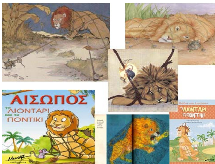
Εικόνα 1. Διαφορετικές εικόνες για εξώφυλλα του ίδιου μύθου

Εξώφυλλα. Από διαφορετικές εκδόσεις συλλέγονται εξώφυλλα (ή εικόνες που θα μπορούσαν να χρησιμεύσουν ως εξώφυλλο) να εικονίζουν τον ίδιο ήρωα σε διαφορετικές φάσεις της εξέλιξης της πλοκής και σε διαφορετικές συναισθηματικές καταστάσεις. Τα παιδιά παρατηρούν τα συναισθήματα των ηρώων και περιγράφουν τη σκηνή που απεικονίζεται σε καθένα από αυτά εστιάζοντας στον τρόπο που αισθάνεται ο ήρωας. Κάποιες φορές μάλιστα τους ζητείται να αντιστοιχήσουν μια εικόνα με μια λέξη που εκφράζει συναισθηματική κατάσταση. Έτσι με αφορμή το γνωστό αισώπειο μύθο Το λιοντάρι και το ποντίκι , έχουν επιλεγεί εικόνες όπου το λιοντάρι νιώθει Λυπημένο, Αισιόδοξο, Απορημένο, Αδιάφορο, Απελπισμένο, Θυμωμένο. Αρχικά τα παιδιά προσπαθούν να αντιστοιχήσουν εικόνα και επίθετο και στη συνέχεια να φτιάξουν το δικό τους εξώφυλλο αποτυπώνοντας τη συναισθηματική κατάσταση του λιονταριού που θεωρούν ότι θα εξυπηρετούσε καλύτερα τις λειτουργίες του εξωφύλλου.