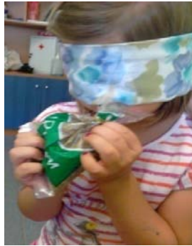
Αναγνώριση με κλειστά μάτια