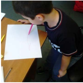
Ζωγραφική με το στόμα