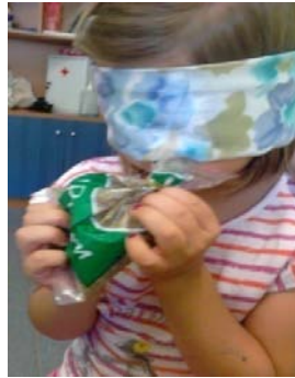
Αναγνώριση με κλειστά μάτια