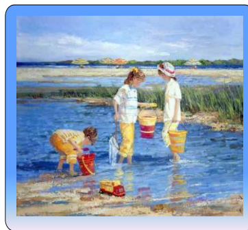
Εικόνα 1: Ενδεικτικός ζωγραφικός πίνακας της παρουσίασης

Καθώς το θέμα των καλοκαιρινών διακοπών είναι ιδιαίτερα αγαπητό στους μικρούς μαθητές προβλήθηκε παρουσίαση, που είχε δημιουργηθεί από τη συγγραφέα του σεναρίου για να εξυπηρετήσει τους σκοπούς του, με συναφείς προς αυτό πίνακες ζωγραφικής, η οποία πλαισιωνόταν από τη μουσική σύνθεση του Vivaldi «4 εποχές» και συγκεκριμένα «το καλοκαίρι». Στόχος ήταν η επαφή με μεγάλα έργα τέχνης τόσο στη ζωγραφική όσο και τη μουσική, η αισθητική τους απόλαυση και η ανάπτυξη της φαντασίας και παρατηρητικότητας των μαθητών.