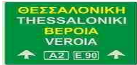
Εικόνα 2: Ενδεικτική πινακίδα του παιχνιδιού

Ακολούθως, αφού ολοκλήρωσαν τις εργασίες στο Βιβλίο του Μαθητή πραγματοποιήθηκαν τις αρχικές εικόνες του Τετραδίου Εργασιών (τεύχος α', σελ. 16), οι οποίες αφορούσαν πινακίδες και εξώφυλλα παιδικών βιβλίων. Μετά από συζήτηση σχετικά με τις εικόνες και το περιεχόμενό τους οι μαθητές δουλεύοντας σε ομάδες κλήθηκαν να επεξεργαστούν ένα παιχνίδι που είχε δημιουργηθεί για τις ανάγκες του σεναρίου, ήταν εγκατεστημένο στον υπολογιστή της κάθε ομάδας και περιείχε πινακίδες, εξώφυλλα βιβλίων, κ.α.