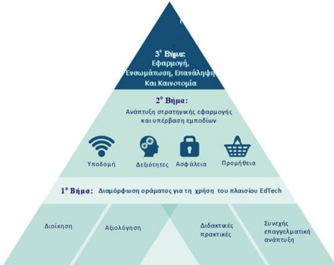
Σχήμα 3. Το EdTech πλαίσιο για αλλαγή

Η παρακολούθηση της εφαρμογής και η συνεχής αναθεώρηση των υλοποιούμενων δράσεων, υπό το πρίσμα της εκπαιδευτικής καινοτομίας, αποτελεί το τρίτο επίπεδο της στρατηγικής για την ενσωμάτωση της τεχνολογίας στην εκπαίδευση. Σε επίπεδο εφαρμογής, οι επιχειρούμενες παρεμβάσεις περιλαμβάνουν την προσαρμογή των αναλυτικών προγραμμάτων, προκειμένου να αναδειχθούν οι δυνατότητες των σύγχρονων ψηφιακών μέσων στη διδασκαλία και τη μάθηση. Κομβικό σημείο για την επιτυχημένη εφαρμογή της Στρατηγικής αποτελεί η δημιουργία « κουλτούρας, όπου τα σχολεία, τα κολλέγια και τα πανεπιστήμια της Αγγλίας θα είναι κατάλληλα εξοπλισμένα, για να μπορούν να αξιοποιήσουν τα πλεονεκτήματα της εκπαιδευτικής τεχνολογίας, με συνέπεια η επιχειρηματικότητα να καταστεί ικανή να καινοτομεί και να αναπτύσσεται » (Department for Education, 2019: 17).