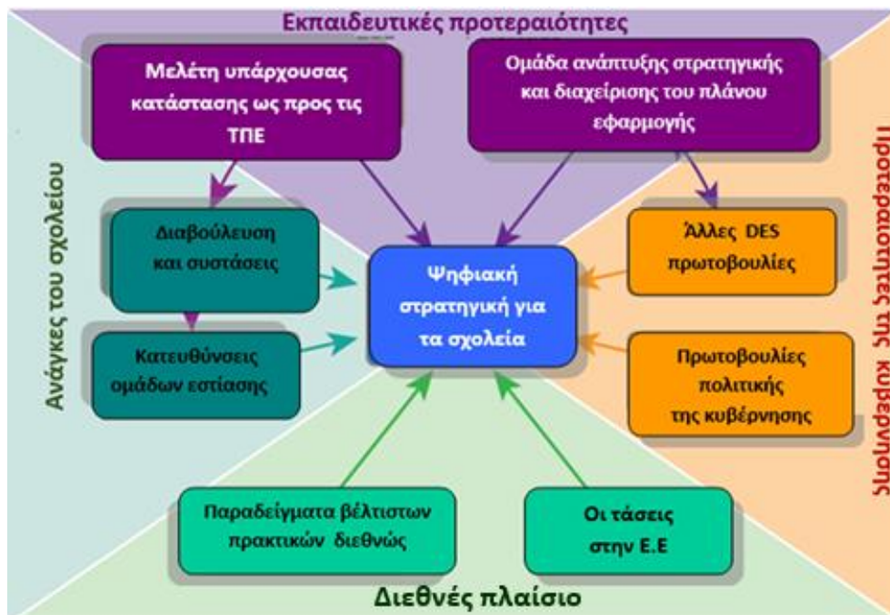
Σχήμα 2. Βασικές Προτεραιότητες της Ψηφιακής Στρατηγικής για την Εκπαίδευση της Ιρλανδίας

Η ψηφιακή στρατηγική αξιοποιεί τις εμπειρίες από τις προηγούμενες παρεμβάσεις για την ενσωμάτωση των ΤΠΕ στα σχολεία και περιλαμβάνει δράσεις που αποσκοπούν στην ένταξη των ΤΠΕ στην Πρωτοβάθμια και Δευτεροβάθμια εκπαίδευση. Στο πλαίσιο της εκπαιδευτικής αυτής στρατηγικής η αξιοποίηση των ψηφιακών τεχνολογιών στη διδασκαλία, τη μάθηση και την αξιολόγηση ακολουθεί μια ολιστική προσέγγιση και συνεξετάζει παραμέτρους, όπως είναι η ηγεσία, η εκπαιδευτική πολιτική, ο σχεδιασμός της διδασκαλίας και της μάθησης και η ενίσχυση της έρευνας με σκοπό την εκπαιδευτική αλλαγή. Επίσης, οι επιχειρούμενες δράσεις ευθυγραμμίζονται και συμπληρώνουν τις πρωτοβουλίες για τη στήριξη αντίστοιχων ψηφιακών στρατηγικών στους τομείς της επαγγελματικής εκπαίδευσης και κατάρτισης, καθώς και της τριτοβάθμιας εκπαίδευσης.