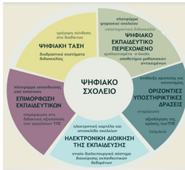
Σχήμα 4. Βασικές προβλεπόμενες δράσεις των έργων «Ψηφιακό Σχολείο Ι και Ψηφιακό Σχολείο ΙΙ»

επιμορφωτικές δράσεις διαρθρώνονται στη βάση ενός συνεκτικού πλαισίου δραστηριοτήτων που περιλαμβάνουν την εκπαίδευση επιμορφωτών (σε Πανεπιστημιακά Κέντρα Επιμόρφωσης), τη διεξαγωγή επιμορφωτικών συνεδριών στα Κέντρα Επιμόρφωσης (Κ.Σ.Ε.), την παροχή διαδικτυακών υποστηρικτικών υπηρεσιών (helpdesk, Moodle, αποθετήρια κλπ), την πιστοποίηση των εκπαιδευτικών σε βασικές δεξιότητες (Α' επίπεδο) και στο επίπεδο Β1, την οργάνωση μητρώων εκπαιδευτικών κέντρων και επιμορφωτών. Η επιμόρφωση Β1 επιπέδου απευθύνεται σε εκπαιδευτικούς όλων των κλάδων και ειδικοτήτων και περιλαμβάνει θεματικές, όπως είναι η αξιοποίηση των δυνατοτήτων που παρέχουν οι εκπαιδευτικές πλατφόρμες, τα αποθετήρια ψηφιακού υλικού, τα διαδραστικά συστήματα διδασκαλίας, καθώς και θέματα ασφαλούς χρήσης του διαδικτύου.