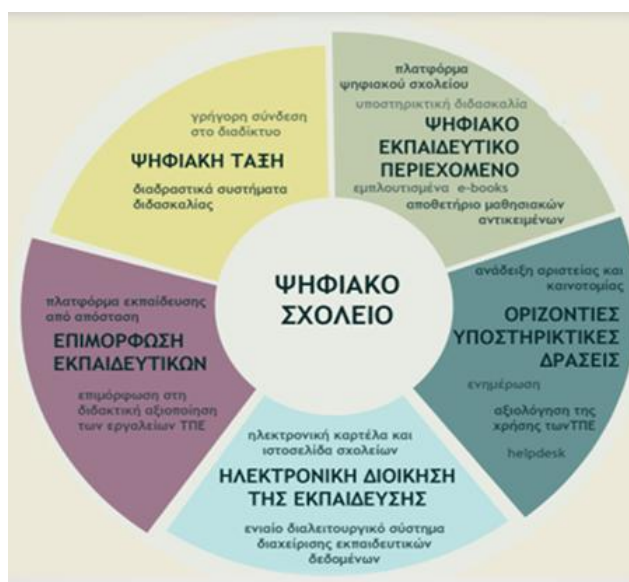
Σχήμα 4. Βασικές προβλεπόμενες δράσεις των έργων «Ψηφιακό Σχολείο Ι και Ψηφιακό Σχολείο ΙΙ»

επιμορφωτικές δράσεις διαρθρώνονται στη βάση ενός συνεκτικού πλαισίου δραστηριοτήτων που περιλαμβάνουν την εκπαίδευση επιμορφωτών (σε Πανεπιστημιακά Κέντρα Επιμόρφωσης), τη διεξαγωγή επιμορφωτικών συνεδριών στα Κέντρα Επιμόρφωσης (Κ.Σ.Ε.), την παροχή διαδικτυακών υποστηρικτικών υπηρεσιών (helpdesk, Moodle, αποθετήρια κλπ), την πιστοποίηση των εκπαιδευτικών σε βασικές δεξιότητες (Α' επίπεδο) και στο επίπεδο Β1, την οργάνωση μητρώων εκπαιδευτικών κέντρων και επιμορφωτών. Η επιμόρφωση Β1 επιπέδου απευθύνεται σε εκπαιδευτικούς όλων των κλάδων και ειδικοτήτων και περιλαμβάνει θεματικές, όπως είναι η αξιοποίηση των δυνατοτήτων που παρέχουν οι εκπαιδευτικές πλατφόρμες, τα αποθετήρια ψηφιακού υλικού, τα διαδραστικά συστήματα διδασκαλίας, καθώς και θέματα ασφαλούς χρήσης του διαδικτύου.