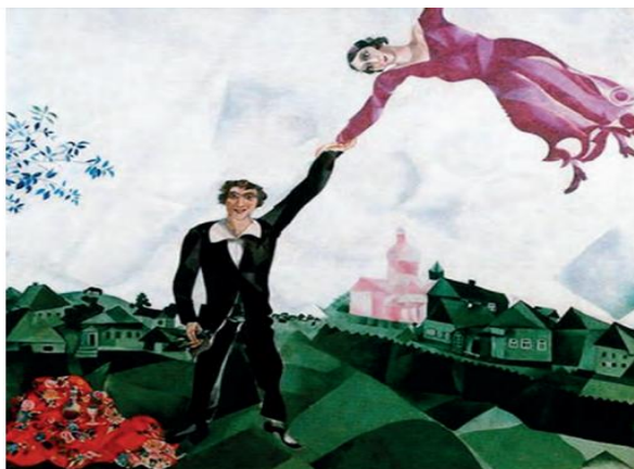
Μαρκ Σαγκάλ, Ο περίπατος, 1918.

Ο «διάλογος» αυτός αποτελεί προϊόν σύγκρισης του παραπάνω λογοτεχνικού κειμένου με τον πίνακα του Μαρκ Σαγκάλ που ακολουθεί.