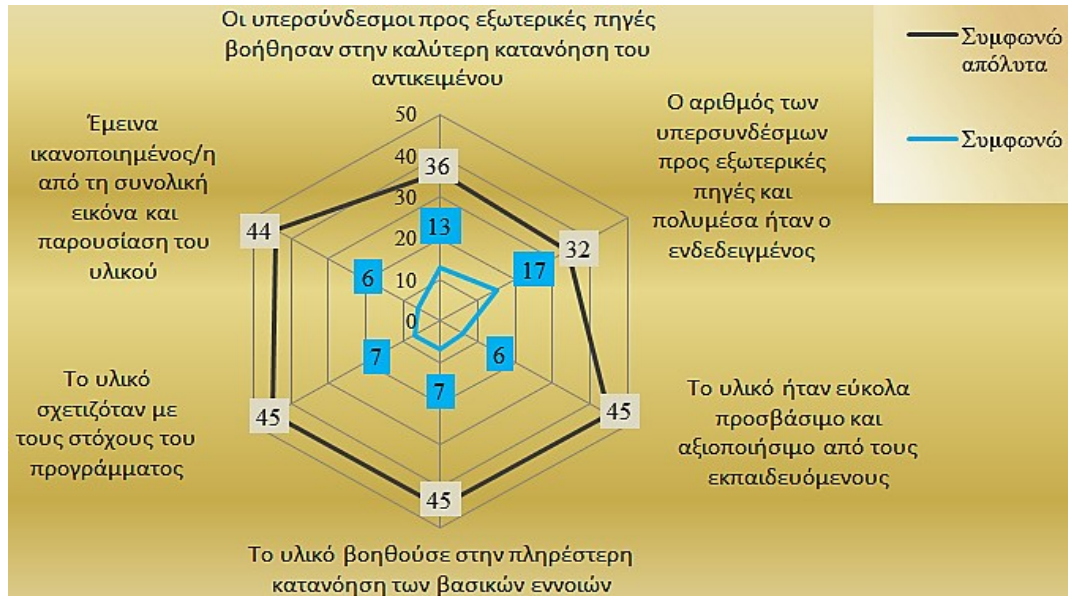
Γράφημα 1: Αραχνοειδές γράφημα απόλυτων συχνοτήτων ως προς τη δομή/οργάνωση του υλικού

Σχετικά με τη μεταβλητή δομή και παρουσίαση των θεματικών εννοιών του υλικού, παρατηρείται ότι τα επίπεδα των θετικών εκτιμήσεων των ηγετών ήταν υψηλά, όπως αποτυπώνεται στην ακόλουθη σχηματική παράσταση (Γράφημα1):