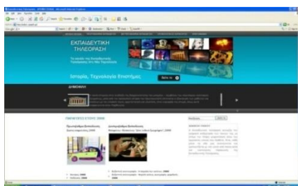
Σχήμα 1: Ο δικτυακός τόπος της Διεύθυνσης Εκπαιδευτικής Ραδιοτηλεόρασης

Από τον Σεπτέμβριο του 2010 η ΔΕΤ μπαίνει στην ψηφιακή εποχή και συνδέεται οργανικά με τους νέους ανθρώπους και τις κοινότητές τους. Αναγνωρίζει ότι η γνώση είναι μια διαδικασία σε διαρκή εξέλιξη και θέλει να γίνει μέρος και καταλύτης αυτής της διαδικασίας: μετασχηματίζεται σε μια multimedia πλατφόρμα, συνδεδεμένη με τους σημαντικότερους ιστότοπους κοινωνικής δικτύωσης και προσφέρει στους μαθητές και τις ομάδες τους, σε δασκάλους και καθηγητές τα εργαλεία και το περιβάλλον για να σχεδιάσουν και να πραγματοποιήσουν τα δικά τους multimedia projects. Αναλαμβάνοντας ενεργό ρόλο στη σύνδεση του σχολείου με τον μαθητή δημιουργό, ερευνητή, πολίτη του κόσμου και συμβάλλοντας στην ανάπτυξη της οπτικοακουστικής παιδείας, δίνει τη δυνατότητα στην εκπαιδευτική κοινότητα να δημιουργήσει περιεχόμενο ( User Generated Video, User Generated Content ) αξιοποιώντας τα προσφερόμενα εκπαιδευτικά βίντεο. Οι μαθητές μπορούν να τα επαναχρησιμοποιήσουν (re-use), να σχεδιάσουν και να “ανεβάσουν” τα δικά τους βίντεο, να τα μοιραστούν (share) και αξιολογήσουν (Τσακαρέστου, 2010) μέσω της νέας πλατφόρμας www.i-create.gr (Μάρτιος, 2011).