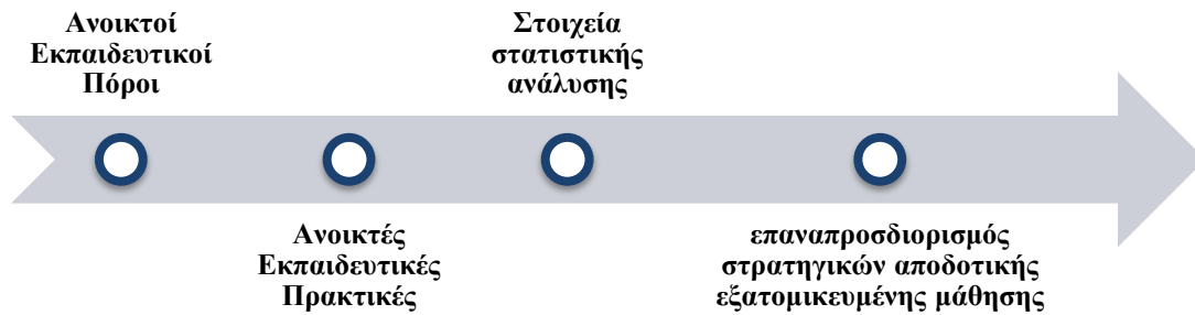
Σχήμα 1: ΑΕΠ και αποδοτική εξατομικευμένη μάθηση

προσδιορίζουν τις ανάγκες για πρόσθετη στήριξη ανάλογα με το «μαθησιακό στυλ» του και να αναπροσαρμόζουν τις μεθοδολογίες μάθησης.