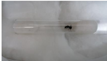
Εικόνα 6: σωλήνας διαμονής των μυρμηγκιών.

Αρχικά τα μυρμηγκια βασίλισσες τοποθετήθηκαν σε τρεις γυάλινους δοκιμαστικούς σωλήνες ξεχωριστά, όπως φαίνεται στην εικόνα 6.