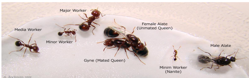
Εικόνα 3: τύποι μυρμηγκιών σε μία φωλιά

Στην εικόνα 3 ( https://forum.antscanada.com/viewtopic.php?t=2601 ) αναπαρίστανται όλοι οι διαφορετικοί τύποι μυρμηγκιών που υπάρχουν μέσα σε μία φωλιά.