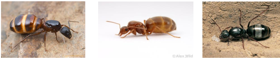
Εικόνα 4: μυρμήγκια - βασίλισσες των ειδών Camponotus , Prenolepis imparis , Formica

3) Η κοιλιά των βασίλισσών, ιδιαίτερα στα είδη των Formicinae είναι πολύ μεγάλη και τις προδίδει. Στην εικόνα 4 φαίνονται τρεις βασίλισσες των ειδών Camponotus , Prenolepis imparis και Formica .