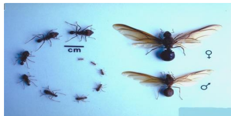
Εικόνα 1: διαφορετικό μέγεθος μυρμηγκιών ανάλογα με το είδος

Οι βασίλισσες είναι μεγαλύτερες από τους εργάτες και τα αρσενικά μυρμηγκία. Στην εικόνα 1 που ακολουθεί φαίνεται η διαφορά μεγέθους του θηλυκού μυρμηγκιού.