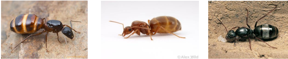
Εικόνα 4: μυρμήγκια - βασίλισσες των ειδών Camponotus , Prenolepis imparis , Formica

3) Η κοιλιά των βασίλισσών, ιδιαίτερα στα είδη των Formicinae είναι πολύ μεγάλη και τις προδίδει. Στην εικόνα 4 φαίνονται τρεις βασίλισσες των ειδών Camponotus , Prenolepis imparis και Formica .