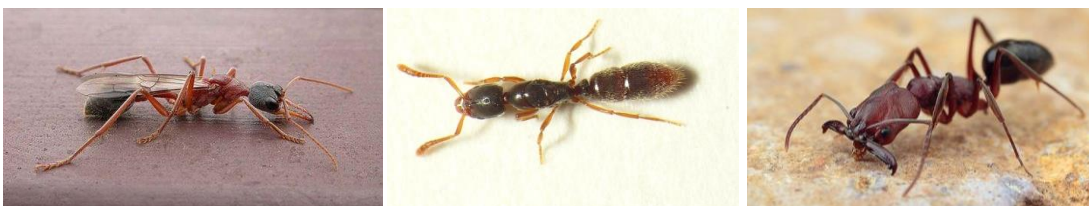
Εικόνα 5: μυρμήγκια – βασίλισσες των ειδών Myrmecia , Ponera , Odontomachus

Εξαιρέσεις αποτελούν κυρίως είδη της υποοικογένειας των Myrmicinae που περιλαμβάνει μια υπέροχη ποικιλία σε μεγέθη και ιδιομορφίες τα οποία για να επιβιώσουν πρέπει να ψάξουν για την τροφή τους αφού βρουν ένα κατάλληλο μέρος να φωλιάσουν. Στην εικόνα 5 φαίνονται τα είδη Myrmecia ( https://commons.wikimedia.org/wiki/File:Myrmecia_nigriceps_(3286511273).jpg ), Ponera ( https://commons.wikimedia.org/wiki/File:Ponera_coarctata_queen.jpg ) και Odontomachus ( https://www.alexanderwild.com/Ants/Taxonomic-List-of-Ant-Genera/Odontomachus/i-twcR8kd ).