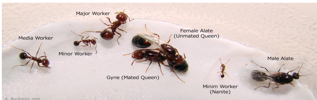
Εικόνα 3: τύποι μυρμηγκιών σε μία φωλιά

Στην εικόνα 3 ( https://forum.antscanada.com/viewtopic.php?t=2601 ) αναπαρίστανται όλοι οι διαφορετικοί τύποι μυρμηγκιών που υπάρχουν μέσα σε μία φωλιά.