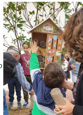
Avô do Diogo