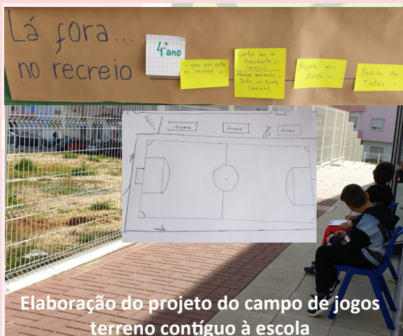
Elaboração do projeto do campo de jogos terreno contíguo à escola

Santa Marta do Pinhal, 23 de Janeiro de 2019